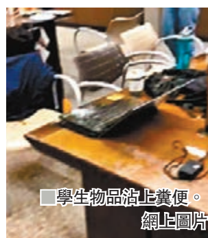
學生物品沾上糞便。