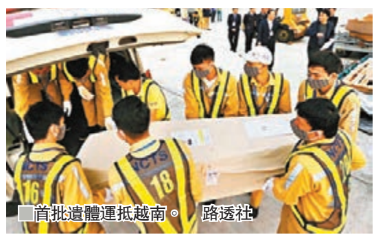
首批遺體運抵越南。

39名死者大部分來自越南中部，首批16具遺體已於昨晨從倫敦，經空路運抵河內，其後分別被運回他們位於義安、河靜和廣平省的家鄉，由家屬處理身後事。