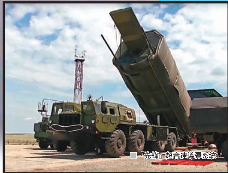
「先鋒」超音速導彈系統

俄羅斯國防部前日公佈，俄羅斯官員將從週日起一連3天，向美國官員展示最新「先鋒」超音速導彈系統。「先鋒」可攜帶核彈頭，估計能以27倍音速飛行，預料下月正式部署，勢將掀起美國和歐盟研發新一代防禦系統，抗衡「先鋒」的潛在威脅。