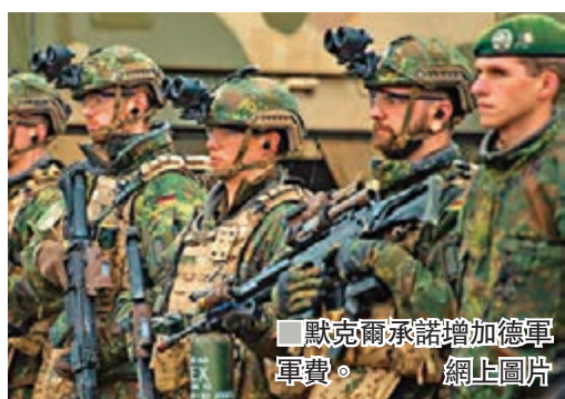
默克爾承諾增加德軍軍費。

馬克龍本月初接受英國《經濟學人》專訪時，稱美國與歐洲缺乏戰略合作，加上土耳其單方面出兵敘利亞，形容北約已形同腦死亡，引起德國不滿。據報默克爾早前在柏林圍牆倒下30周年紀念晚宴上，曾當面斥責馬克龍，批評他常作「破壞式政治」，導致她需