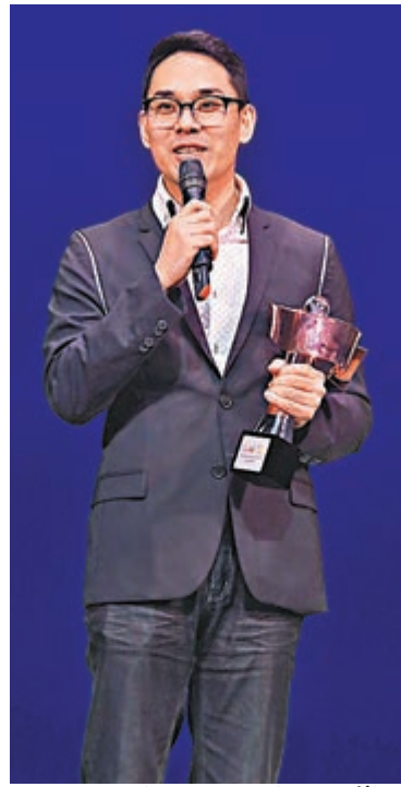
■梁兆明獲網上最具人氣演員獎。