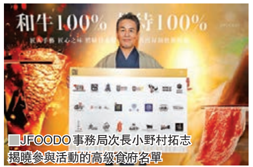
■JFOODO事務局長次小野村拓志揭曉參與活動的高級餐府名單