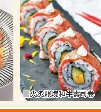
■火炙照燒和牛壽司卷