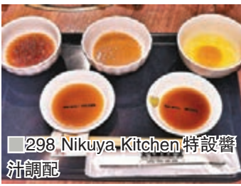
■298 Nikuya Kitchen特設醬汁調配