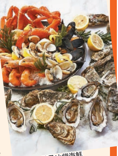
■即開生蠔及冰鎮海鮮

位於帝都酒店的2+2 cafe，今個冬日，由12月5日至明年2月29日，餐廳嚴選上乘食材，以龍蝦、生蠔及和牛入饌，推出「龍蝦、生蠔、和牛海鮮自助餐」，配以多款甜品及Movempick雪糕，為大家帶來三重奢華滋味享受。