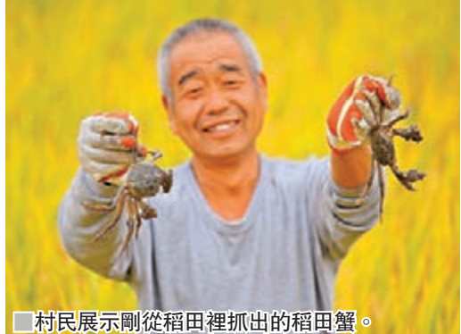
■村民展示剛從稻田裡抓出的稻田蟹。

早前，河北省廊坊市安次區落堡鎮裴務村300餘畝優質水稻成熟，養殖的稻田蟹也進入捕撈期。據了解，稻田蟹利用水稻與螃蟹之間的生態關係，減少水稻農業噴灑和螃蟹飼料餵食，實現農民經濟收益與生態環境改善雙豐收。