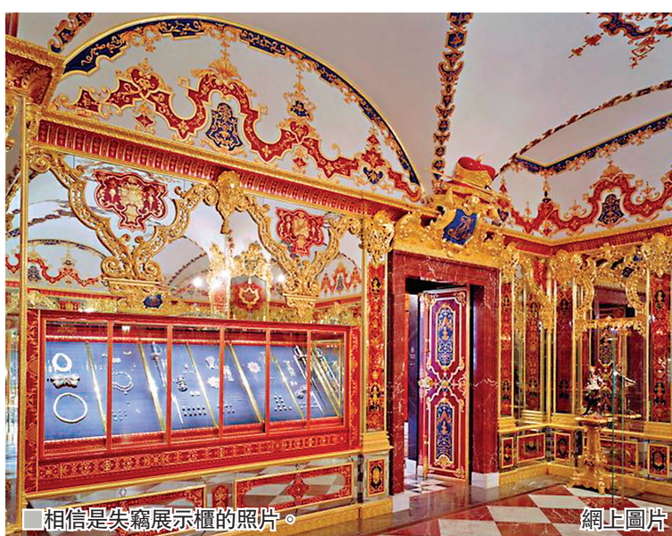
相信是失竊展示櫃的照片。網上圖片