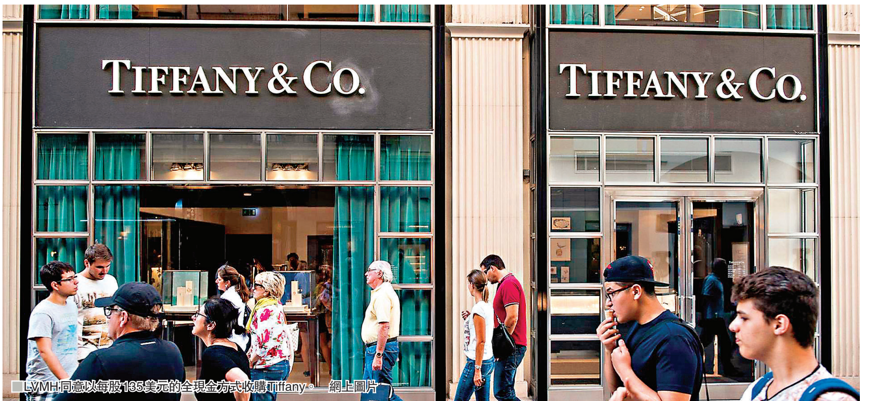
LVMH同意以每股135美元的全現金方式收購Tiffany。