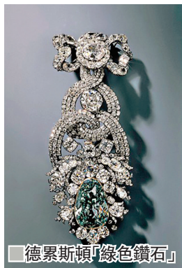
德累斯頓「綠色鑽石」。