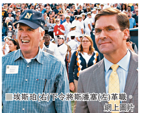
埃斯珀(右)下令將斯潘塞(左)革職。