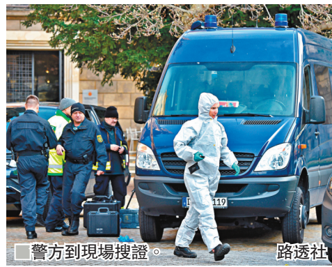
警方到現場搜證。