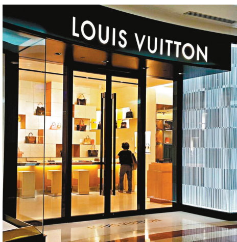
收購計劃有助LVMH拓展市場。

LVMH落實收購Tiffany，分析指出今次交易是一次雙贏，對LVMH而言可拓展市場，對Tiffany而言則可鞏固公司實力，162億美元約1,268億港元作價不算過高。