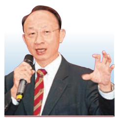
黎偉成 資深財經評論員