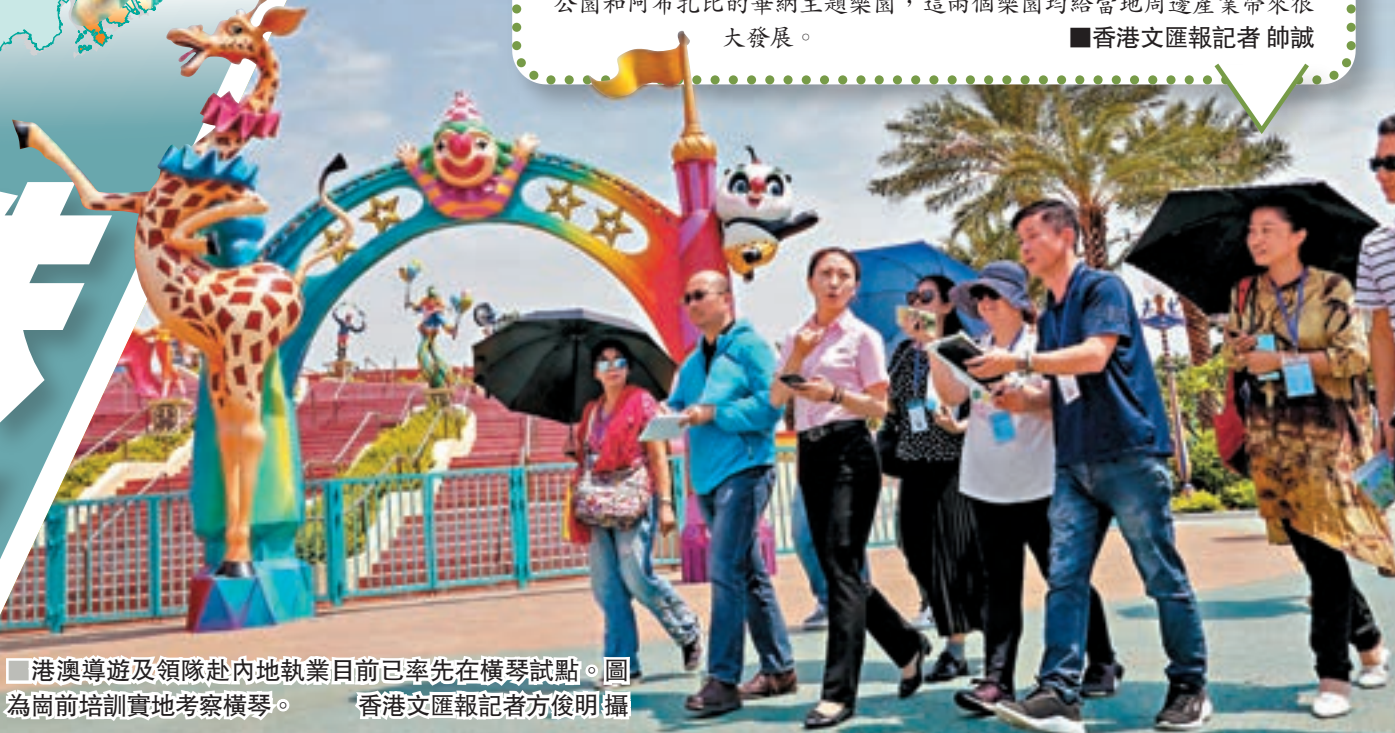
■ 港澳導遊及領隊赴內地執業目前已率先在橫琴試點。圖為崗前培訓實地考察橫琴。