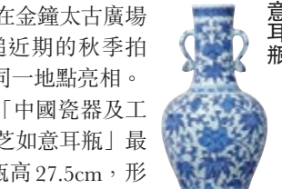
乾隆青花秋葵瑞芝如意耳瓶

有業界資深人士指出，乾隆皇帝在藝術審美上慕古創新，並接受西洋美學，在對前朝藝術進行仿製以表喜愛和致敬時，又懷有超越前人的雄心。他們從大量歷史文獻中可知乾隆對成化瓷器的重視程度，而此瓶以新樣創製，紋飾融合成化青花宮碗及西方繪畫之技法，別有新意，「堪稱傳世孤品」。