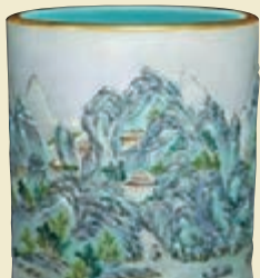
嘉慶粉彩浮雕通景山水圖紋筆筒