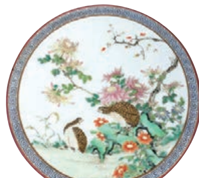
乾隆磁胎彩繪錦上添花安居樂業圖蓋盒

本月初，香港佳士得秋拍巡展登京，除了帶去多件秋拍重點拍品外，還首度向外發售了秋拍中的一件重器「康熙磁胎彩繪千葉蓮碗」。這件被佳士得形容為磁胎彩繪巔峰之作的御瓷，將在本月27號假香港會展中心舉行的佳士得秋拍專場中以諮詢價（估價1億）上拍。