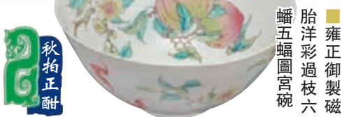
雍正御製磁胎彩繪過枝六蝠五蝠圖宮碗

東京中央香港2019秋季拍賣昨至25日假香港四季酒店舉行。是季拍賣，東京中央推出「中國重要瓷器及藝術品」、「日本書畫家高橋廣峰成扇珍藏」、「中國古代書畫」等7場專拍，茲選其重點作推介，以饗讀者。