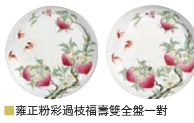
雍正粉彩過枝福壽雙全盤一對

「重要中國瓷器及工藝精品」專拍的乾隆「磁胎彩繪錦上添花安居樂業圖蓋盒」燒製周正，下承四如意雲頭足，蓋面以白彩為地藍料彩繪回紋一周為框，其內蓋面隆起形成仿金銀器鏤雕工藝效果，並繪安居樂業圖於其上，以一對鸚鵡相顧於花石之間，寓意安居樂業，白釉細膩，彩料明快，繪畫生動。盒外壁以軌道工藝及洋彩繪錦上添花紋，剔繪技法精細，所繪牽牛花等四季折枝花卉，花朵豔麗，填彩精細。盒內及外底滿施松石綠釉，底部支釘處繪綠彩彩花紋遮蓋，工藝繁複。