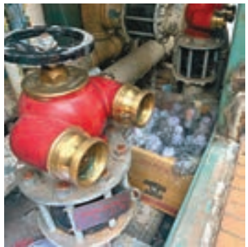
浸大消防栓內藏有大批汽油彈。

據了解，警方在接報後到場檢查，懷疑物品是用玻璃瓶承載的易燃液體，並在現場搜證及將這些物品移除，事件中並無任何人被捕。