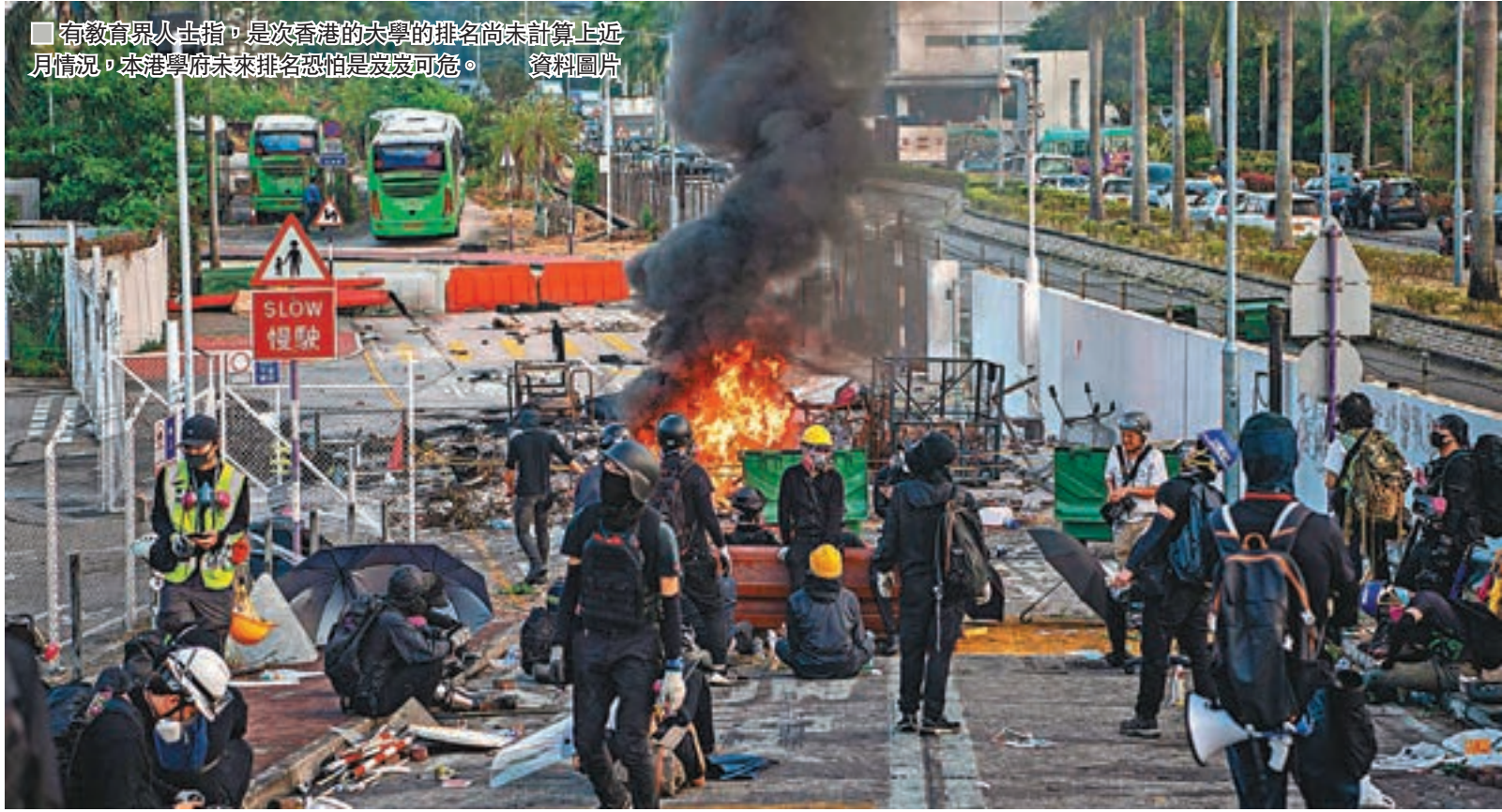
有教育界人士指，是次香港的大學排名尚未計算上近月情況，本港學府未來排名恐怕是岌岌可危。資料圖片

香港文匯報訊(記者 姬文風)香港中文大學及理工大學先後遭黑衣魔強佔淪「暴力戰場」，校園各處滿目瘡痍，國際聲譽嚴重受損，近日就連大學排名亦告觸礁。英國《泰晤士高等教育》(THE)陸續公佈2020年多個學科排名，中大及理工大多個學科均錄得下跌。其中，理大工程與科技學科較去年大跌26名，中大法律學科更是急瀉足足42名，幾乎跌出百大。有教育界人士昨日在接受香港文匯報訪問時表示，自違法「佔中」以來，政治入侵大學校園問題嚴重，學術持續受負面影響，近日更接連發生教職員遭禁錮、大學停擺等前所未見的嚴重破壞，未來香港的大學排名跌幅恐怕還會加劇。