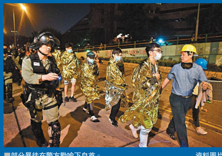
部分暴徒在警方勸喻下自首。資料圖片