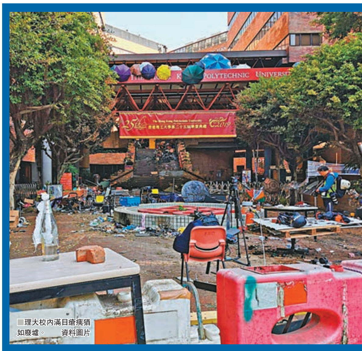
理大校內滿目瘡痍猶如廢墟。資料圖片

警方指出,這幾點一直清晰向社會傳達,但有關報道中提及在機場被捕的黑衣魔年齡實為22歲,在離開理大後就應該被捕,但他在警方協調中心登記身份資料和拍照後,聲稱身體不適,故警方讓他登上救護車往醫院。不過,該青年在抵達醫院後,並沒有看醫生,而是伺機偷偷登上同黨接應的私家車逃離醫院而被警方緝獲。其後,該青年企圖經機場飛往台灣,在機場被警方拘捕,揭發他只買單程機票,有理由相信他潛逃,故予以拘捕。