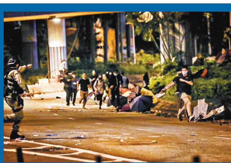
部分暴徒欲逃跑被警員追截。