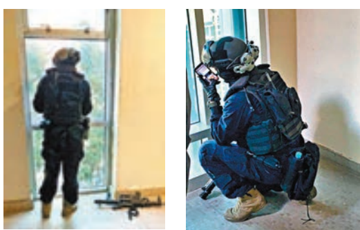
飛虎隊員在博物館內的行動情況被人偷拍並上傳到網上公開。

有飛虎隊隊員在館內執行職務期間,一名男子懷疑以手機偷拍執行職務中的飛虎隊人員,包括其身旁的槍械,更即時將照片上傳到社交媒體公開,又說明拍攝地點。