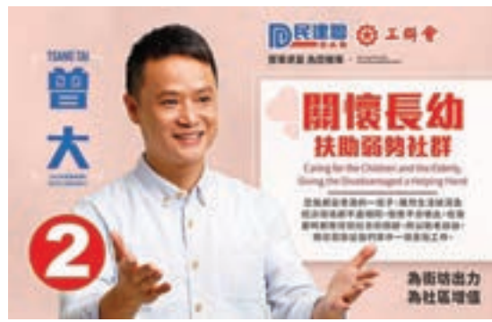
曾大以「助老扶幼，關懷弱勢」作為工作重點之一。曾大fb圖片

他曾聯同工聯會髮型義工隊定期在區內為長者義剪髮；見到家長和小朋友平日生活各有各忙，於是在假日舉辦親子活動，如電影欣賞、親子工作坊等，促進親子關係，並和醫療團體合辦不同類型疾病講座及健康檢查，推動社區健康，舉辦節日活動，還曾在颱風「山竹」後組織居民