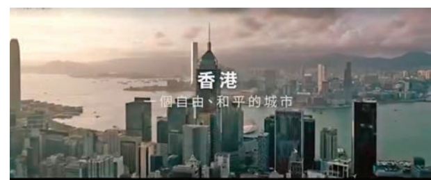
▲▼ 民建聯製作短片呼籲市民積極投票。

面對5個月沒有休止的黑色恐怖，愛護香港的普通市民如何才能救香港？民建聯日前在facebook發佈短片，呼籲市民為和平自由的香港不再選擇沉默，在周日（24日）投出自由理性的一票給民建聯，「奪回屬於你的自由。」