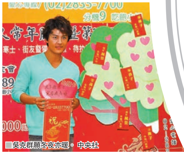
■吳克群願冬夜亦暖。中央社