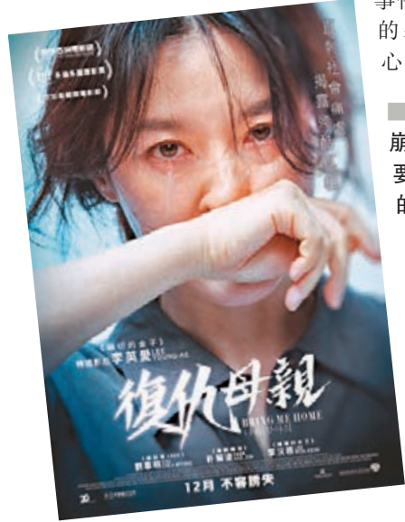
■李英愛飾演瀕臨崩潰的母親，誓要尋回被擄走的兒子。

香港文匯報訊 闊別大銀幕14年，「大長今」李英愛強勢回歸，拍攝新作《復仇母親》，飾演一位瀕臨崩潰的母親，誓要尋回被擄走的兒子。兒子失蹤6年，赫然傳來疑是孩子下落的消息，李英愛飾演的母親決定隻身走到漁村，希望找到失散多年的兒子。奈何冷血的村民聯手魔警想把孩子留下當生財工具，將她拒諸門外。母親唯有在雷雨交加的晚上，以極端手段再闖虎穴。而電影導演金承右則是首次執導，根據韓國真實社會事件改編，描繪由心而發的暴力，教人觸目驚心。