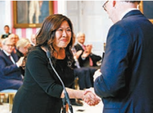
■伍鳳儀是杜魯多政府中唯一華人。