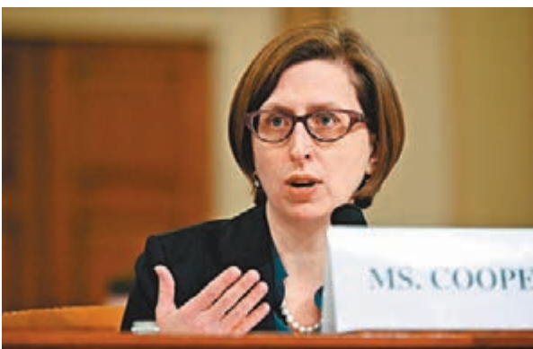
■庫珀的證詞推翻了共和黨的論據。 路透社

表示，他是在特朗普的指示下，以舉行首腦峰會為條件與烏克蘭作交換，要求烏方對拜登展開調查。被問及特朗普扣起軍援是否為向烏國施壓時，桑德蘭承認特朗普未曾直接提及行動和調查拜登有關，但認為他的動機顯而易見，如「二加二等於四」。桑德蘭亦在聽證會上公開和國務卿蓬佩奧的通訊記錄，指他曾向對方交代會使澤連斯基展開調查，以換取軍援，蓬佩奧則在電郵中稱「你做得很好，繼續保持」。 ■美聯社/路透社/法新社