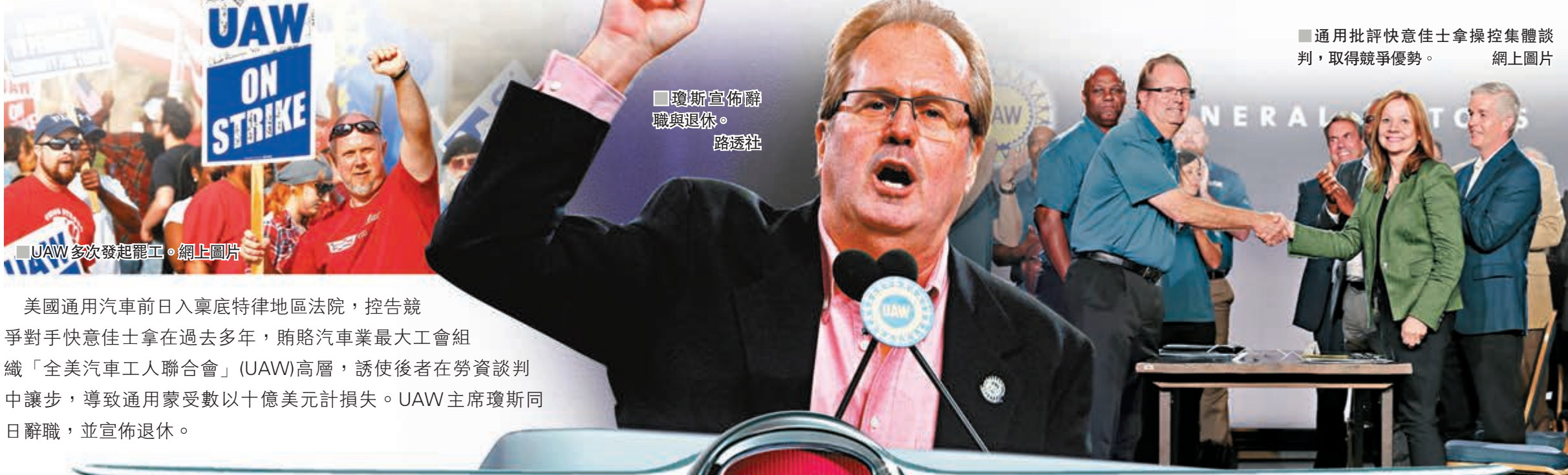
■UAW多次發起罷工。網上圖片