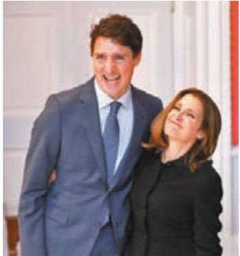
■方慧蘭(右)升任副總理。

杜魯多表示，新團隊反映了政府的優先事項。分析指，杜魯多的自由黨在大選後失去在西部艾伯塔省及薩斯喀徹溫省所有議席，相信任命艾伯塔省出身的方慧蘭出任副總理，目的是要調停聯邦政府與西部各省的矛盾，尤其是氣候變化及能源政策等。 ■綜合報導