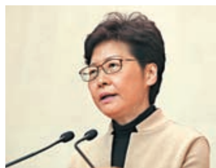
■林鄭月娥認為引用緊急法有清晰的法律基礎。