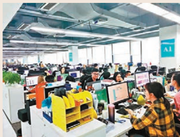
創夢天地有900員工,其中逾三成為研發人員。

「希望三年後自研遊戲收入佔比升至七八成。」 「明年上半年娛樂互動體驗店將達到30家。」