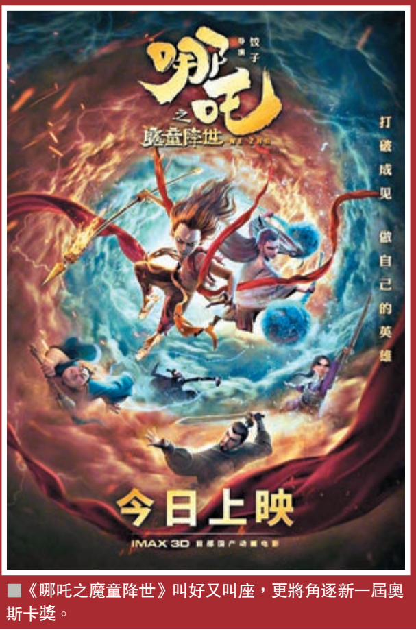
《哪吒之魔童降世》叫好又叫座,更將角逐新一屆奧斯卡獎。

另外,圍繞知名科幻小說改編打造的《三體》動畫版也於近日公佈了首支正式PV,令粉絲期待的《三體》動畫確定將於2021年正式上線。