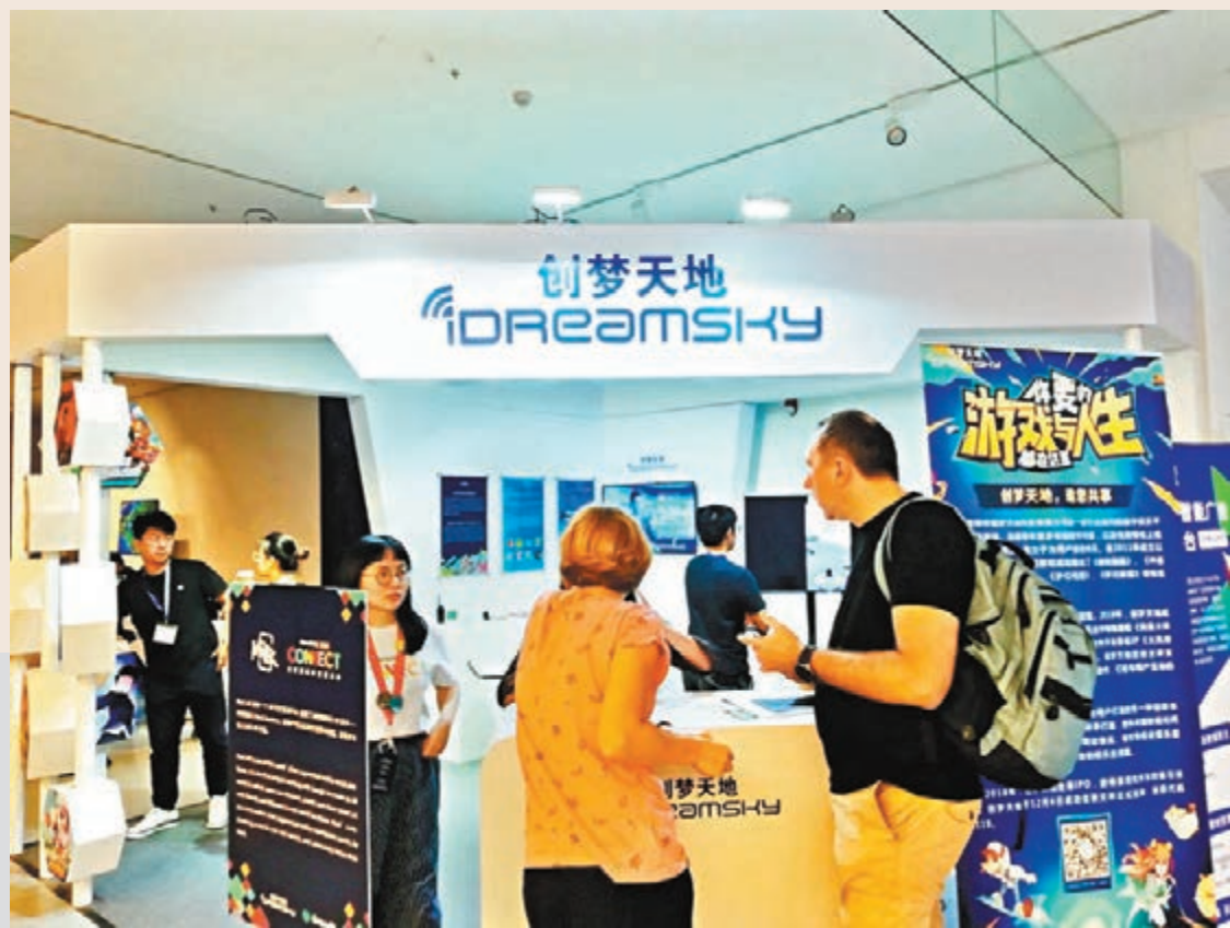
創夢天地加強遊戲自主研發,年底將推出一款上線,預計高峰時吸引百萬萬人玩。

另外,陳湘宇稱公司正大力拓展線下市場,在深圳和廣州等開設線下遊戲互動娛樂體驗店,名稱為騰訊視頻好時光,主要整合了騰訊視頻、電競、創夢天地自研和代理的遊戲以及飲食等,遊戲玩家在體驗店可以花更長體驗、娛樂和消費,並可以給線上業務帶來流量。目前在深圳和廣州等城市已開業的體驗店有16家,年底還有4家開業,明年4-5月將有新的10家店投入運營,屆時合計有30家運營。這些體驗店面積500至2,000平米。目前一家體驗店一年收入500萬元,未來3-5年將在全國開設200家,料給公司帶來1.5億的收入。 因為與騰訊合作帶來更多的議價能力,體驗店能夠吸引許多95後青年前來消費,也成為許多商場和購物中心爭相的目標,因此店舖租金獲得不少優惠,一些配套企業也樂意給予他們低成本甚至是免費的合作。