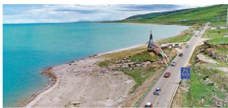
青海湖流域植被、濕地恢復明顯，流域周邊生態環境不斷向好的方向發展。

香港文匯報訊（記者李陽波西寧報道）作為中國最大的內陸湖，位於青藏高原東北部的青海湖近年來面積一直持續增大。香港文匯報記者昨日從青海省政府網站獲悉，自啟動實施青海湖流域生態環境保護與綜合治理工程以來，青海湖流域生態持續向好，水體面積達19年來最大值。