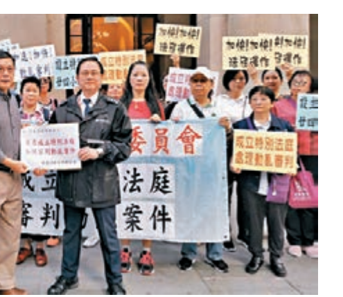
港島各界聯要求成立特別法庭專門處理暴亂案。