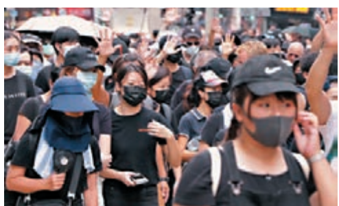
法律界認為禁蒙面法沒有減少市民遊行集會的權利。圖為早前蒙面示威遊行。

他又認為，禁蒙面法有適當的豁免原則，完全沒有減少市民遊行集會的權利，世界上很多其他國家和地區都有類似的立法，目的只是希望能減少在公眾遊行集會中暴力發生的風險，保障公眾安全。過去多個月遊行集會中，蒙面者所用的暴力和所作的非法行為嚴重，他對法庭說禁蒙面法「對基本權利的限制超乎合理需要」感到「匪夷所思」，認為法庭的判決「堅離地」，與止暴制亂的良好意願背道而馳，只會變相要香港市民繼續忍受暴徒的暴力蹂躪，強調特區政府理應上訴。