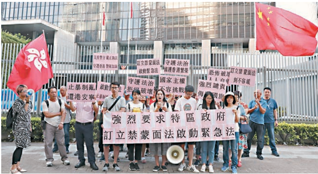
法律界認為法庭裁定禁蒙面法違憲並無全面考慮目前社會實際情況。圖為市民支持政府訂立禁蒙面法。