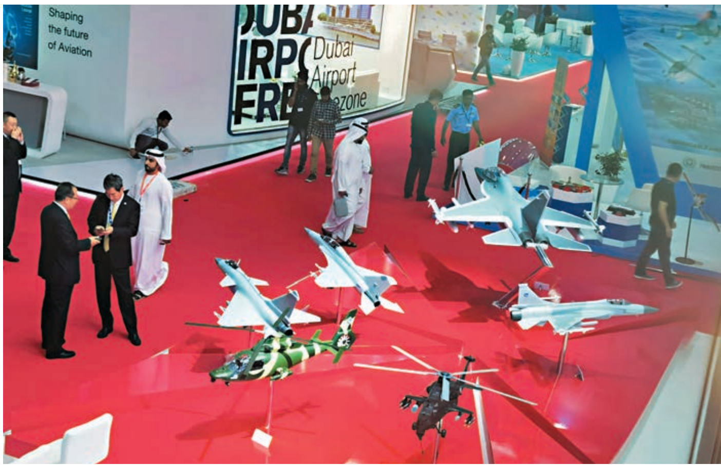
「三代+」戰鬥機殲-10CE亮相第16屆迪拜航展,U8EW察打一體無人直升機同展。圖為展館飛機模型。

無人機方面,突出代表中國航空工業中端無人機研發實力的「翼龍」系列無人機體系化展示。「翼龍」系列無人機適合執行偵察、監視和對地打擊等任務,且具有較強的擴展能力,經擴展可執行情報收集、電子戰、搜救等任務。