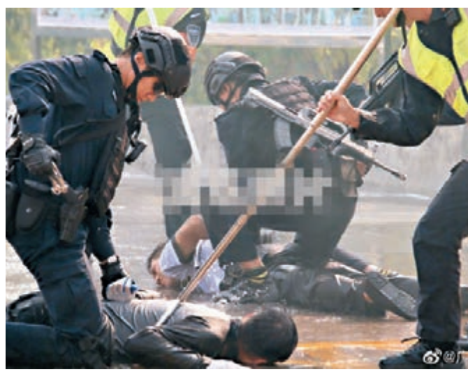
廣州市成功舉行「朱雀」2019反恐維穩處置演練。

體現了反恐演練立足底線、挑戰極限、探索未知、引人深思的本質要求。演練中,首次引入一大批新技術、新戰術、新機制,塑造還原各類「恐怖襲擊」的真實場景,充分考驗各反恐隊伍在極端情況下的應急處突能力,令人耳目一新。其中,「網絡攻擊與無人機攻擊反制」「人質與危化品運輸車輛劫持解救」等新科目的設置,充分體現廣州反恐演練貼近科技發展潮流及實戰場景需求,切實提高全市應對高暴力與高科技、高智力相結合的重大、複雜、新型暴恐事件的綜合處置能力,前瞻探索重大暴恐事件情境構建,科學編制危險化學品爆炸重大恐怖襲擊事件應急處置模板,初步展示扁平化、智能化、可視化警務指揮新模式。演練取得了預期理想效果。