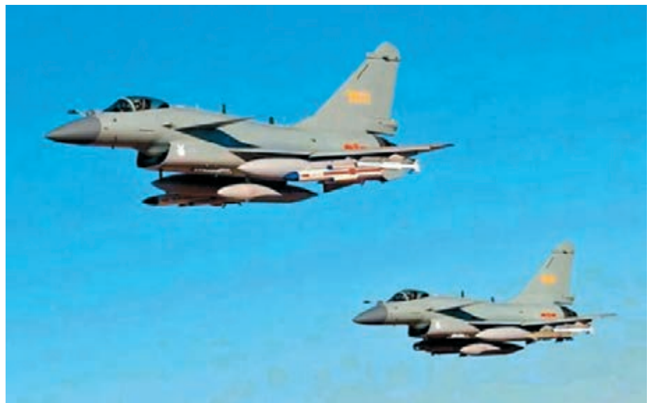
攜帶反輻射導彈和激光制導炸彈的殲-10C戰鬥機。

中國人因工程高峰論壇由中國航天員科研訓練中心人因工程國家級重點實驗室倡議發起,本屆論壇由中國載人航天工程辦公室和中山大學共同主辦,於16日至17日在廣州舉行。