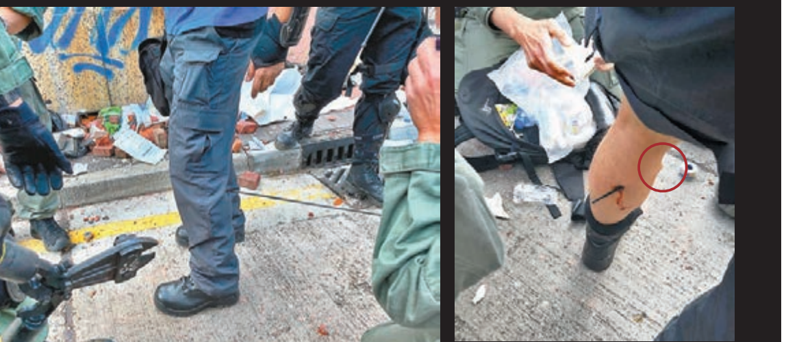
■一名警長小腿中箭，同炮用鉗將箭尾鉗斷。