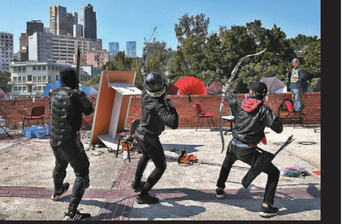
■暴徒弓箭手從理大向外射箭。

差不多在警長中箭同一時間，另有防暴警員亦在漆咸道南和柯士甸路交界，被黑衣魔發射的鋼珠擊中防暴面罩近鼻樑位置，幸該名警員並無受傷。警方指當時附近有大批傳媒正在採訪，暴徒的狂轟亂射對在場所有人構成嚴重生命威脅。警方嚴厲譴責暴徒有關暴力行動，並形容現場局勢急劇惡化及非常危險，呼籲市民不要前往理工大學一帶。