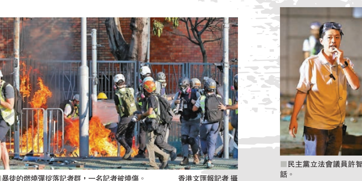
■暴徒的燃燒彈投落記者群，一名記者被燒傷。

警方深夜指出，理大校園內藏有大量的攻擊性武器，包括易燃液體的危險品，警告任何人進入或逗留於理工大學範圍，並協助暴徒均有可能視為參與暴動。現場消息指，部分理大黑衣魔晚上紛紛換衫、爬牆或由小路逃離校園，在校園附近有數十人被捕。