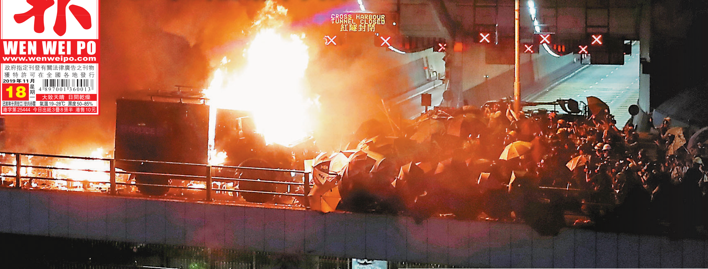
■裝甲車擬越過轉運道天橋的路障，遭黑衣魔狂投燃燒彈。