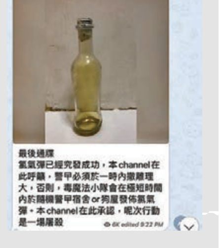
■香港文匯報記者 齊正之

「老豆搵仔」發帖後，「民間記者會」的骨幹亦隨即在專頁貼文召集人，要求立即前往理大救人。大批暴徒得知消息後便立即在多區「開花」，企圖來一場「圍魏救趙」，分散警方，掩護理大暴徒逃走，而在旺角一帶的黑衣魔更試圖避開警察防線，繞路到尖沙咀，用「火魔法」幫理大的暴徒開路。 要求警方一小時內撤離 至晚上10時許，來自各路的暴徒已趕抵九龍一帶準備，之後「老豆搵仔」更以毒氣及警察的家人作威脅，向警方發出「最後通牒」（見右圖），威脅警方必須於一小時內撤離理大，否則「毒魔法」小隊會在短時間內隨機向警察宿舍投擲毒氣彈，更強調行動將會是一場「屠殺」。 另外，「連登仔」也發功，要求泛暴派議員及「和理非」支持者到理大開路，貼文要求「如果一小時內見唔到班議員，會直接擲炒不投票」。不知是巧合還是真的害怕即將到手的選舉會大量流失，公民黨立法會議員譚文豪隨即在Facebook發帖稱，會聯同其他泛暴派議員立即前往理大，「要求警方全面撤離」。民主黨立法會議員許智峯則向警方喊話。