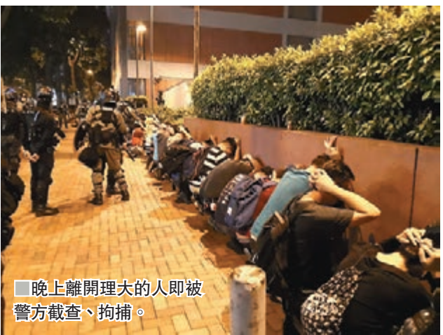
■晚上離開理大的人即被警方截查、拘捕。

香港文匯報訊（記者 蕭景源）理工大學淪為各路黑衣魔的巢穴和施暴的堡壘，日前在全民發起清路障行動時多次阻撓、打人和攻擊警員，由前晚開始更掀起大規模「反清障」暴亂。昨日，暴徒佔據理大各層平台，用巨型彈叉發射汽油彈、磚頭、弓箭及鋼珠，居高臨下無差別狂襲警員和記者，晚上更火燒理大天橋和銳武裝甲車，27小時內狂投上千枚汽油彈，理大周邊的紅磡和尖東部分街區變成一片火海，有警員小腿中箭，有記者被燒傷。警方深夜部署平暴行動，直搗校園驅魔，今晨已將理大包圍，繼續驅散暴徒。警方警告，倘遇致命攻擊，會實彈還擊。