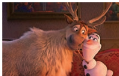
《魔雪奇緣2》與小朋友提早賀聖誕！

從預告片見到，愛莎和安娜將會換上全新造型，靚人靚衫靚景，展開更刺激更精彩的全新冒險，亦會有新角色加盟，為戲迷帶來新鮮感之餘，全新主題歌曲《Into The Unknown》可媲美