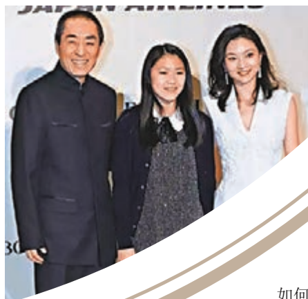
張藝謀攜同妻女到場。