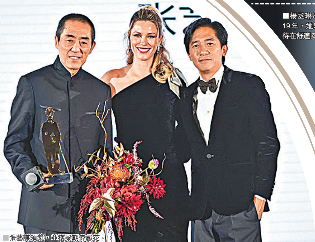
張藝謀領獎，並獲梁朝偉獻花。