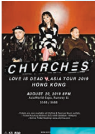
英國流行電音樂團CHVRCHES取消來港演出。

香港文匯報訊(記者李思穎)連月來香港出現暴力示威造成社會不穩定,不安氣氛影響着各行各業,演藝界當然不能獨善其身,演唱會、音樂頒獎禮、商場騷、大集團的年底派對,甚至粵劇界的賀歲檔都面臨嚴重影響,暫時已有超過20個在香港的演出項目相繼取消,藝人商演機會、製作公司和從業人員的工作機會大減。社會若不盡快止暴制亂,回復安寧,恐怕除了旅遊飲食界外,演藝界又是一個重災區。