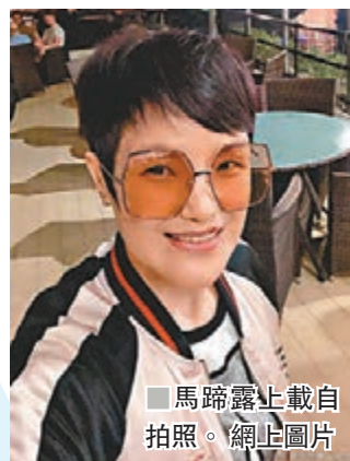
馬蹄露上載自拍照。