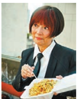
苑瓊丹爆藝人飲食習慣。