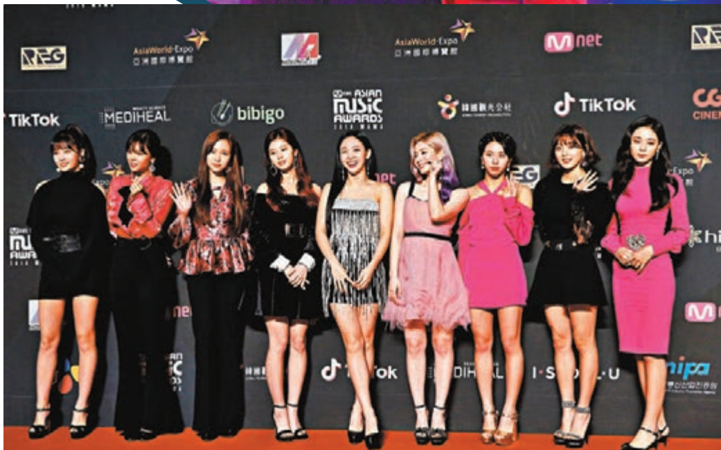
《MAMA》今年不會來港舉行。資料圖片

粵劇界亦受打擊,社區大會堂遭破壞,最少3個劇團被迫取消演出,夜間多突發暴亂事件,長者不方便出夜街,粵劇界班主取消演出,但損失場租,加上演員、工作人員訂金照付,打擊「起班」(籌辦演出)意慾,暫時不敢再「起班」;演員也因為多個演出取消而收入銳減。粵劇從業和年輕演員要保持一定數量的演出方可解決生計問題,需做兼職以幫補家計。