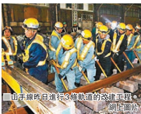
山手線昨日進行3條軌道的改建工程。 網上圖片

是1971年後首個新站，目前已完成約9成工程，預料明年春季開幕。山手線為此需改建3條軌道，導致多個車站停開，而在維持通車的新宿一帶路段，班次也要減少3成。另外，JR京濱東北線由品川至田町一段亦停駛，預料今晨恢復通車。