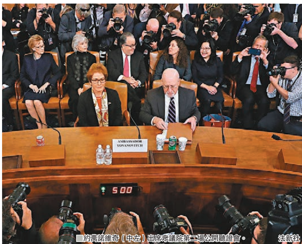
約萬諾維奇(中左)出席眾議院第二場公開聽證會。