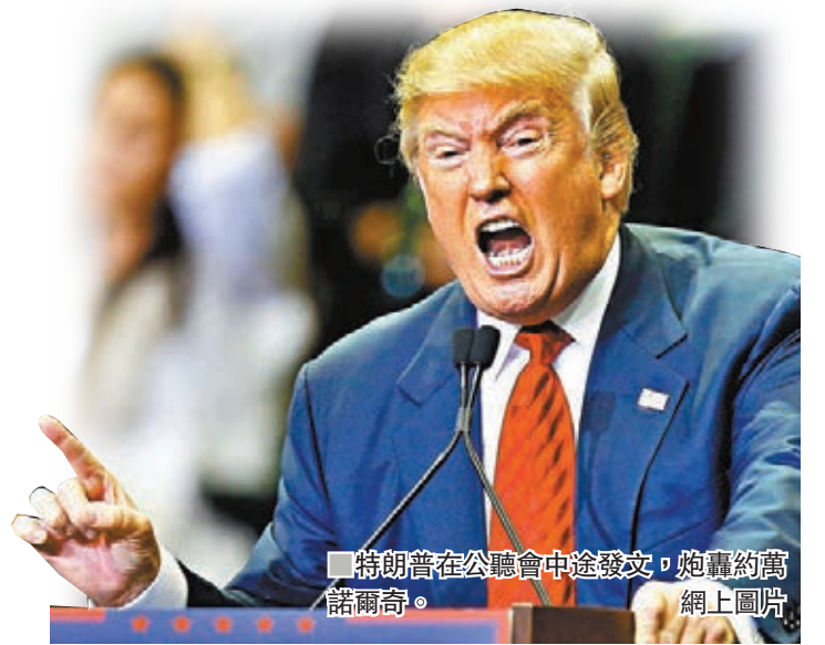
特朗普在公聽會中途發火，炮轟約萬諾維奇。

美國眾議院前日舉行第二場總統彈劾調查公聽會，前駐烏克蘭大使約萬諾維奇就5月被撤職一事作證，形容事件為針對自己的誹謗行動。聽證會舉行期間，總統特朗普竟在twitter發文抨擊約萬諾維奇，民主黨人形容他的舉動如同「實時恐嚇」，約萬諾維奇亦在聽證會上直指感到受威脅。