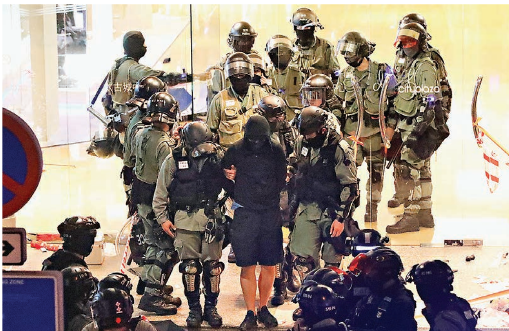
■多國各界人士支持中國政府立場，希望香港盡快止暴制亂、恢復秩序。圖為防暴警察日前拘捕一名破壞店舖黑衣服面暴徒。

阿富汗政治分析師兼專欄作家哈賈圖拉·齊亞說，暴力犯罪分子已經對香港造成了巨大破壞，給香港的商業和教育帶來了巨大損失。現在是時候對暴力犯罪分子採取行動了。齊亞認為，香港如今的動盪局面是由某些國家煽動起來的，這些國家採取雙重標準，旨在破壞地區穩定。暴力犯罪分子應該從一些中東國家的例子裡吸取教訓。過去十幾年，一些中東國家在外部勢力的煽動下爆發了大規模反政府暴力示威，最終陷入血腥衝突與殘酷破壞。