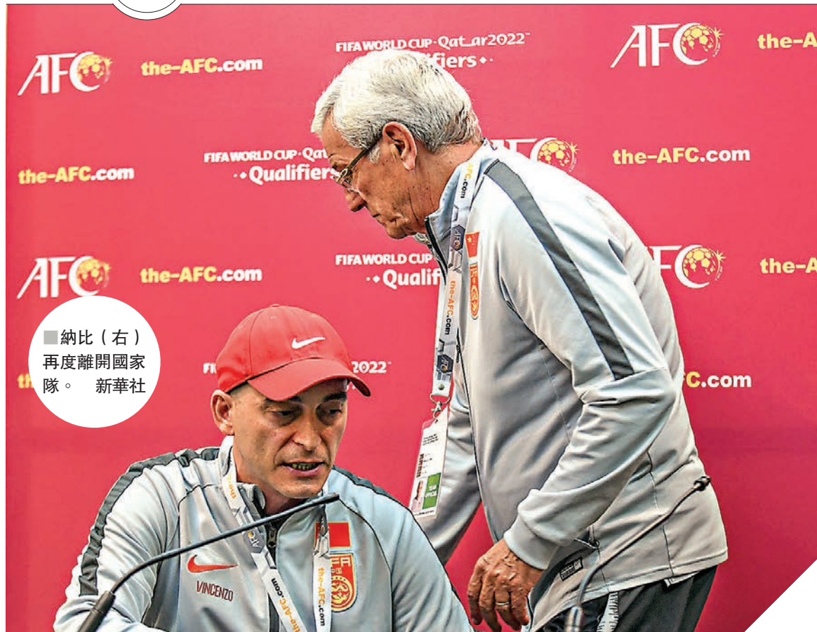
納比(右)再度離開國家隊。新華社