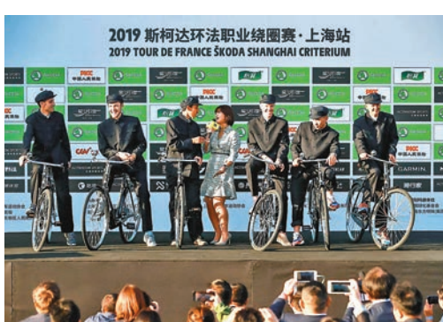
多位明星車手身穿中山裝騎老式自行車亮相。

香港文匯報訊(記者夏微上海報道)2019斯柯達環法職業繞圈賽-上海站的比賽將於今日在上海中華藝術宮前開跑。今年已經環法中國系列賽事落地的第三個年頭，又適逢中法建交55周年和環法黃衫百年誕辰。所以主辦方在賽前發佈會上的設計也是獨具匠心，本屆黃衫得主貝納爾、衣架克魯伊斯基、袖珍小火箭安、西西里鯊魚尼巴利、歐洲之星特倫汀，以及來自中國雲南隊的馬皓身穿中山裝騎着上海老式的二八自行車亮相。