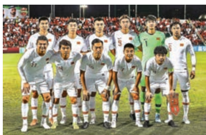
中國隊將繼續改革。

在四十強賽中以1:2輸給敘利亞之後，中國隊離卡塔爾世界盃又遠了一步，而賽後主帥納比再次宣佈辭職，更增添了一絲悲涼的氣氛。