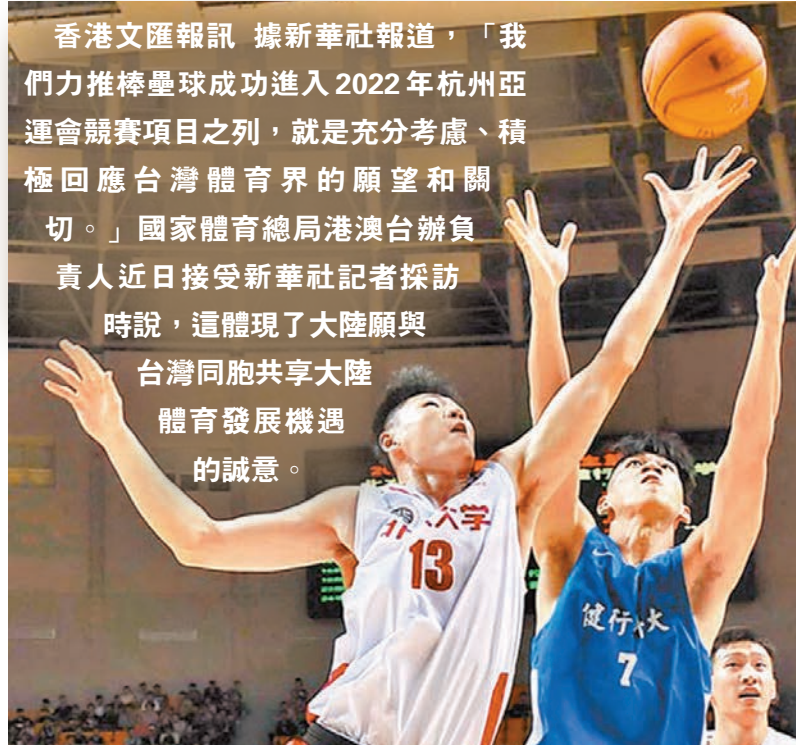
國家體育總局港澳台辦負責人表示，「26條措施」惠及台體育界更好分享陸发展机遇。圖為2019年兩岸大學生籃球賽，北京大學選手(左一)與台灣健行科技大學選手在比賽中拼搶。