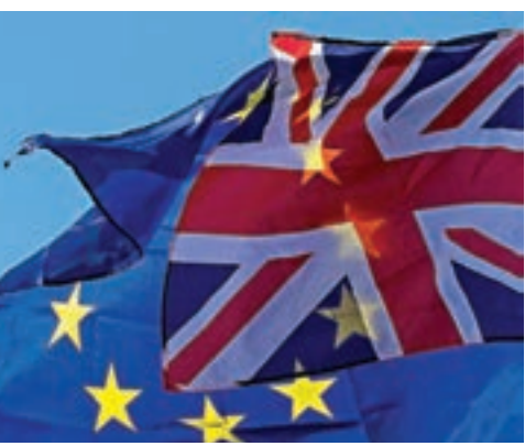
市場近期焦點由脫歐限期延後，轉到英國大選上。資料圖片

全國經濟與社會研究所(National Institute of Economic and Social Research)10月30日表示，首相約翰遜(Boris Johnson)的脫歐協議將導致英國經濟損失700億英鎊，比起留歐，脫歐亦會使經濟於未來十年收縮3.5%。