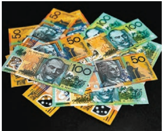
圖為澳元紙幣。資料圖片

澳元兌美元走勢，圖表所見，MACD 指標跌破訊號線，10 天平均線亦剛下破 25 天平均線，匯價亦已連番失守多道平均線，均預示澳元兌美元中短期仍見下跌壓力。以自 10 月初起起的累計漲幅計算，61.8% 的調整幅度將為 0.6770 水平。較大力支持預估在上月初低位 0.6670 以至 0.66 水平。阻力位則回看 25 天平均線 0.6845 以及本月初屢試未破的 0.6930 水平。