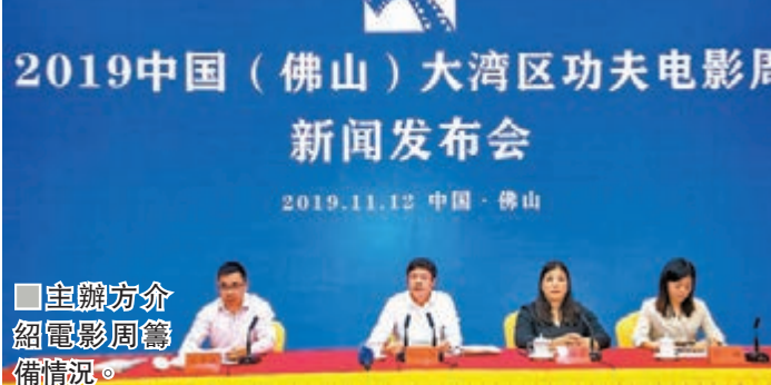
■主辦方介紹電影周籌備情況。

主辦方介紹，四項主體活動中，閉閉幕式將分別在南海區的中央廣播電影總台南海影視城和順德區的佛山國際體育文化演藝中