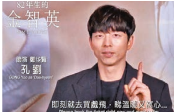
孔劉呼籲港迷即刻去買戲飛。

出自己由出生至今，身為女性而備受種種理所當然的壓迫與痛苦……故事不止涉及重男輕女、性騷擾，甚至延伸至階級歧視等問題，在韓國引起極大迴響，更獲文在寅總統、國民MC劉在錫、防彈少年團隊長金南俊等強力推薦。