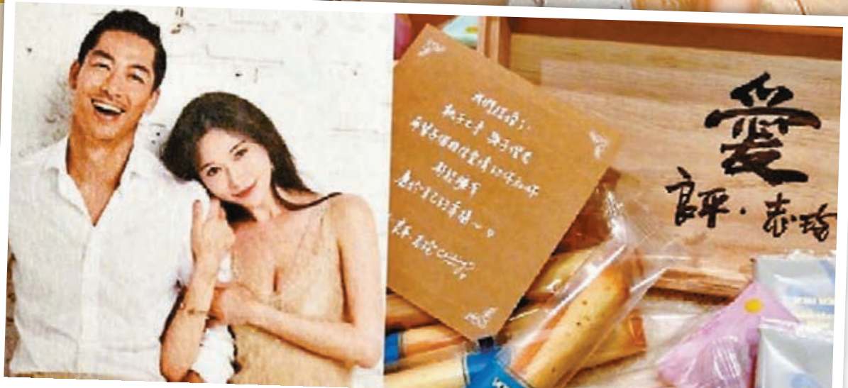
■林志玲選用的喜餅及喜帖曝光。