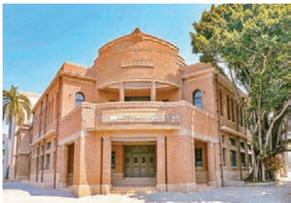
■婚宴選址古蹟台南美術館。

香港文匯報訊（記者 凡文）林志玲今年6月6日宣佈下嫁日本男團「EXILE」放浪兄弟成員AKIRA，近日婚禮地點曝光，11月17日將在台南美術館舉行，據悉林志玲非常喜歡台南市美術館(南美館)1館氛圍，故婚宴選在南美館舉行，館方昨天也證實，前晚已收到租借合約；台南市長黃偉哲表示，台南市政府會為林志玲準備一牛車嫁妝。