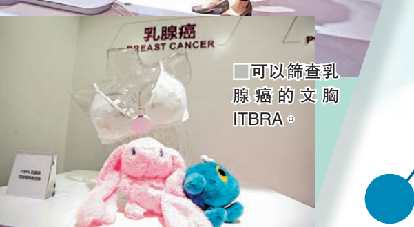
■可以篩查乳腺癌的文胸ITBRA。