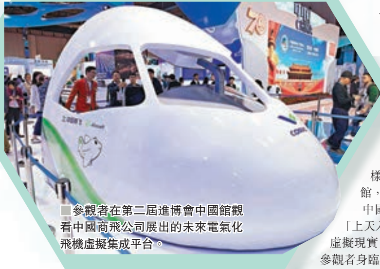
■參觀者在第二屆進博會中國館觀看中國商飛公司展出的未來電氣化飛機虛擬集成平台。