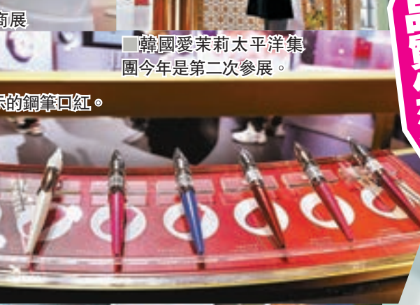
■美妝品牌展示的鋼筆口紅。