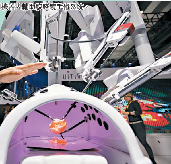
■機器人輔助腹腔鏡手術系統。