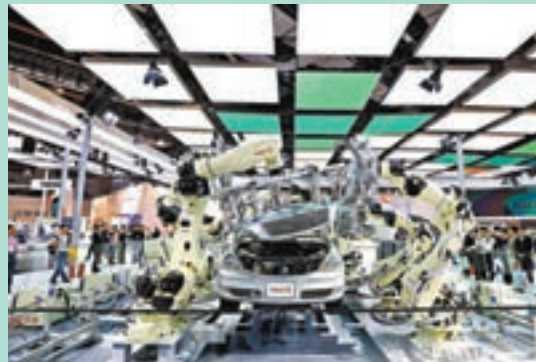
■日本那智不二越公司的超高速點焊SRA系列機器人。