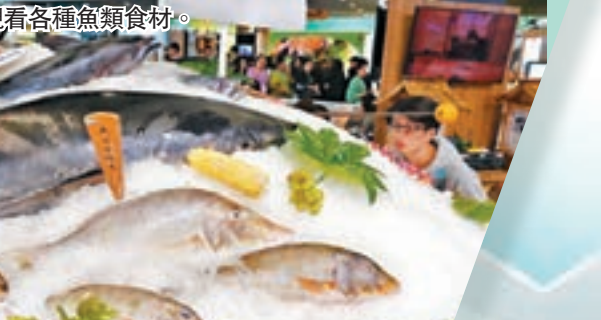
■參觀者觀看各種魚類食材。