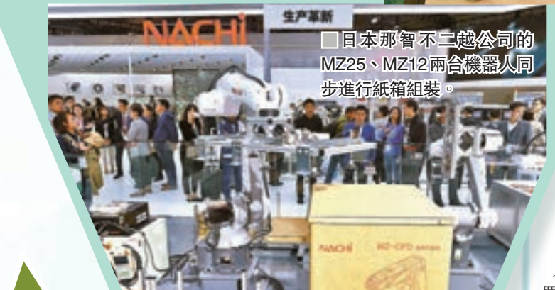
■日本那智不二越公司的MZ25、MZ12兩台機器人同步進行紙箱組裝。