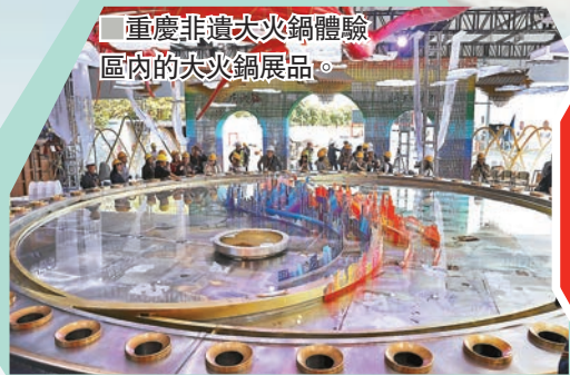
■重慶非遺大火鍋體驗區內的大火鍋展品。

高科技產品的展位更受歡迎，日本那智不二越公司帶來超高速點焊SRA系列機器人及MZ25、MZ12兩台機器人同步進行紙箱組裝；歐姆龍FORPHEUS乒乓球機器人；德國雄克公司帶來一台五指機械手服務型機器人。俄羅斯、意大利都有直升機展銷，波音飛機當然也沒有錯過中國的進博會。採訪者現場見到換名片，加微信，談生意，話合作等的場景無處不在。中國與各方共同努力，再次交出一份耀眼的進博「成績單」：第二屆進博會累計意向成交711.3億美元，比首屆增長23%。碩果累累，近400件全球或中國內地首發新產品、新技術或服務的精彩亮相，共創未來的時代強音。正如習近平主席在開幕式上講過「中國市場這麼大，歡迎大家都來看看」，中國開放的大門越開越大，期待第三屆有更加火熱場面。