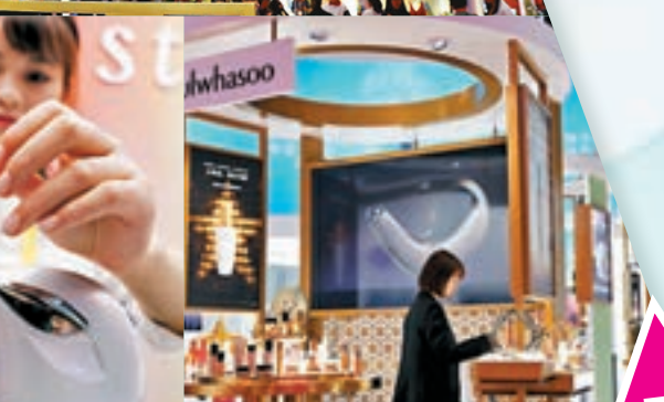
■一家日本美妝展商展示最新智能面膜機。