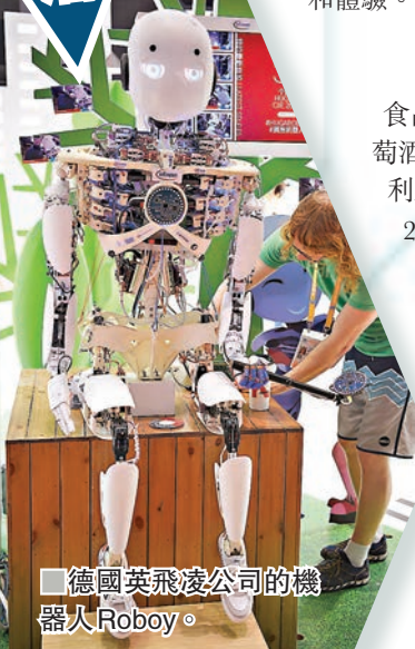
■德國英飛凌公司的機器人Roboy。