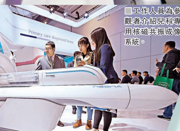
■工作人員為參觀者介紹兒科專用核磁共振成像系統。