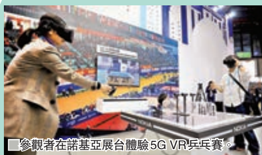
■參觀者在諾基亞展台體驗5G VR乒乓賽。