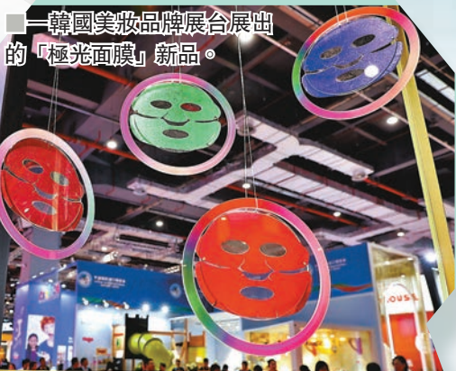
■韓國美妝品牌展出的「極光面膜」新品。