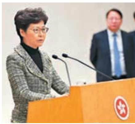
◀林鄭月娥對不向暴力或激進行為妥協、緊守崗位的各行各業的市民表示敬意。

林鄭月娥並指，特區政府目前看不到訂下區議會選舉押後的「死線」，只稱：「在投票日前，行政長官可以因為某些特定原因按法例將選舉押下，但既然我們有一個確保選舉公平、公正、誠實的選管會，選管會亦成立了危管會，我們亦會同時考慮選管會和危管會的意見。」