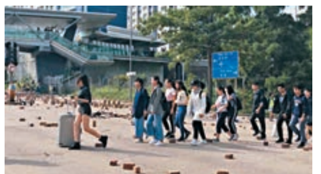
■昨日有城大內地生帶行李離開宿舍。 理大編委圖片

城大校長郭位連同多名副校長及高層亦向師生發電郵提到是次惡意破壞事件，多處地方受損毀，電郵指對此刑事破壞行為作強烈譴責，並表示會對相關人等保留