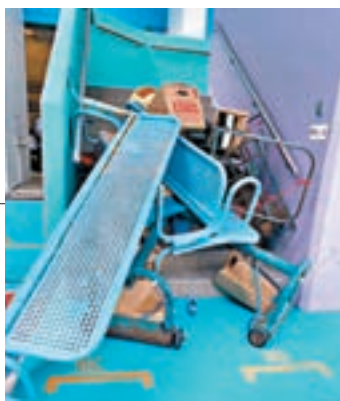
▶相片聲稱攝於東華三院辛亥年總理中學，可見學校樓梯被大量雜物阻塞。 網上圖片