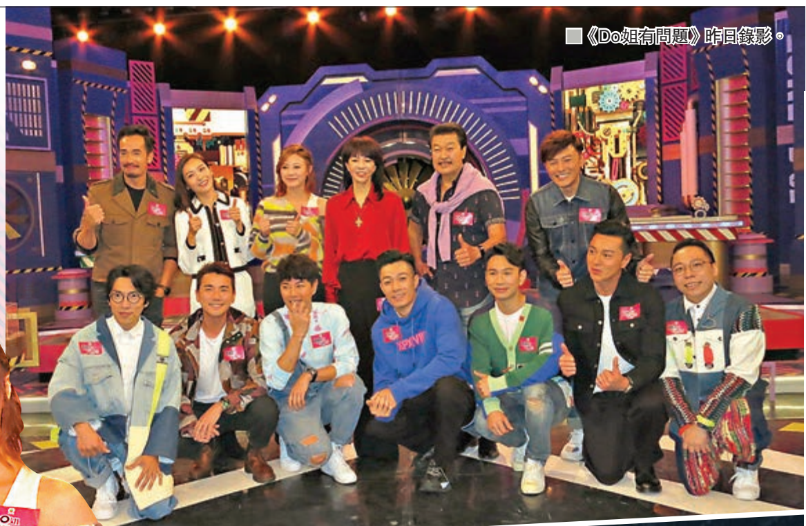
《Do姐有問題》昨日錄影。