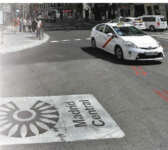
「呼聲」曾成功推倒馬德里低碳排放區計劃。