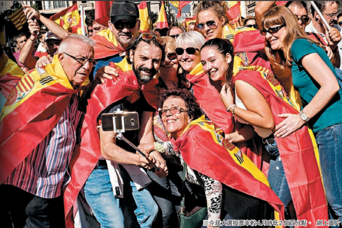
■今屆大選投票率較4月時低2個百分點。

西班牙前日舉行今年第二次大選，結果顯示議席分佈較上一次更分散，無論是左翼或右翼陣營均未能取得過半數議席，意味籌組政府工作將更為艱難。今次大選在加泰羅尼亞獨派暴亂的背景下舉行，令強硬反對「加獨」的極右政黨「呼聲」運動(Vox)成為最大贏家，議席增加超過一倍，躍身成為國會第3大黨。