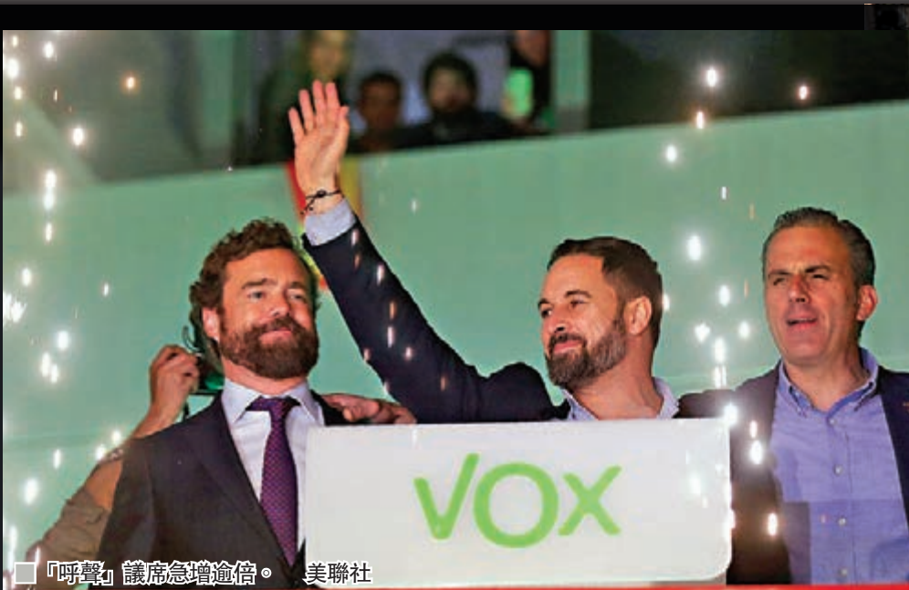
「呼聲」議席急增逾倍。

西班牙前日舉行今年第二次大選，結果顯示議席分佈較上一次更分散，無論是左翼或右翼陣營均未能取得過半數議席，意味籌組政府工作將更為艱難。今次大選在加泰羅尼亞獨派暴亂的背景下舉行，令強硬反對「加獨」的極右政黨「呼聲」運動(Vox)成為最大贏家，議席增加超過一倍，躍身成為國會第3大黨。