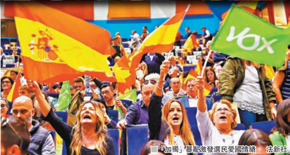
「加獨」暴亂激發選民愛國情緒。