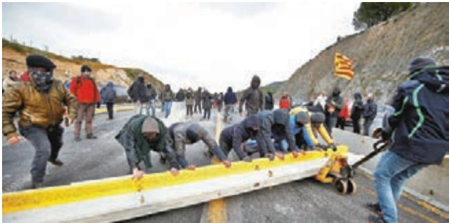
加泰獨派堵路導致交通嚴重擠塞。