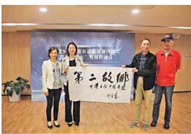
畫展嘉賓合影。

他續說，中國畫走到今天，也做了很多思考、變革，我們力圖走向實踐，在此過程中吸收了西方的一些思想，比如繪畫應該向外，應該對社會