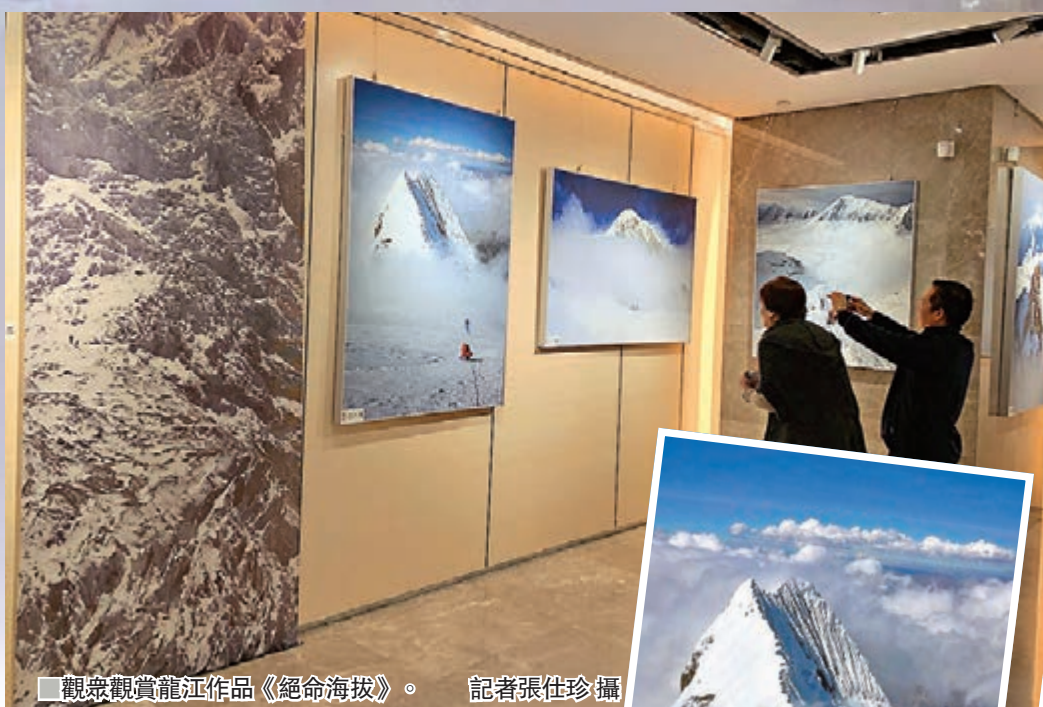
觀眾觀賞龍江作品《絕命海拔》。

作為西北地區最大的影像類綜合性展覽，本屆陝西國際絲路影博會由陝西省攝影家協會、西安市總工會、西安市文聯、西安市攝影家協會共同主辦。博覽會展覽總面積11,000平方米，共設七大展區：「我和我的祖國」主題攝影展區、政府企業社團展區、國際旅遊產業展區、高校攝影展區、攝影器材展區、攝影講座互動娛樂區、收藏精品老相機展區。