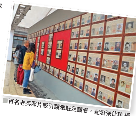
百名老兵照片吸引觀眾駐足觀看。