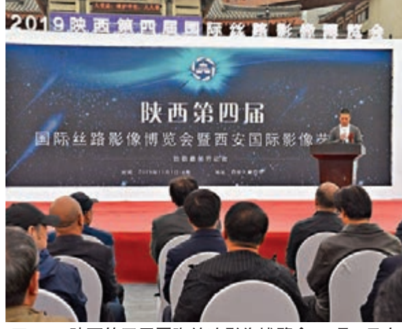
2019陝西第四屆國際絲路影像博覽會11月1日在西安開幕。