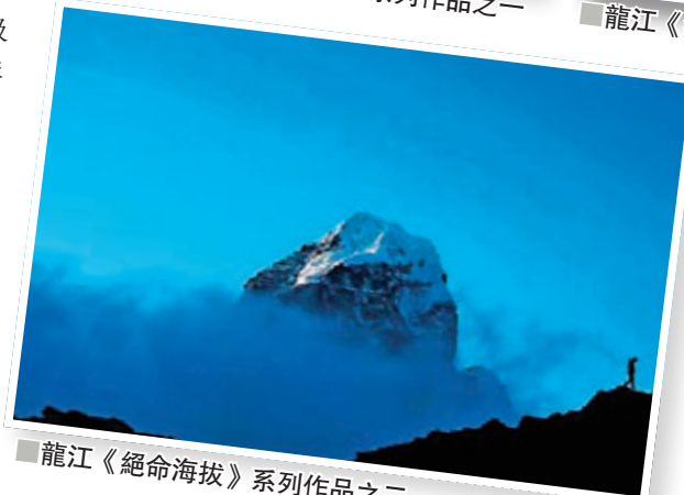
龍江《絕命海拔》系列作品之二