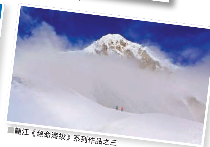
龍江《絕命海拔》系列作品之三