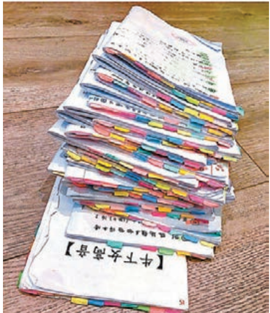
心穎的IG上載了一張《牛下女高音》劇本的相片。