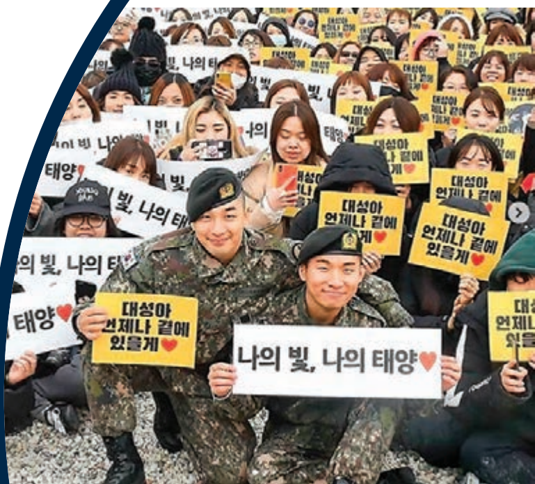
二人跟在場粉絲大合照。網上圖片

香港文匯報訊(記者 凡文)韓國男團BIGBANG繼T.O.P、G-Dragon(GD)退伍後,成員太陽和大聲昨日也正式退伍,太陽、大聲從京畿道龍仁市的陸軍地面作戰司令部復軍。近千名粉絲在兵營外熱情迎接,送上蛋糕和花束歡迎他們。昨日場外聚集了上千名粉絲熱情迎接太陽、大聲,穿著軍服的兩人一出場就讓現場尖叫聲四起,並齊聲接受訪問。太陽表示,非常感謝這麼多人到場,現在還沒有退伍的真實感。他認為在當兵的這段期間非常有意義,特別感謝在這20個月裡給予協助的長官和同袍。大聲則說在軍中學到很多,在當兵的過程中體會到了前所未有的感覺,也學會了理解與體諒。