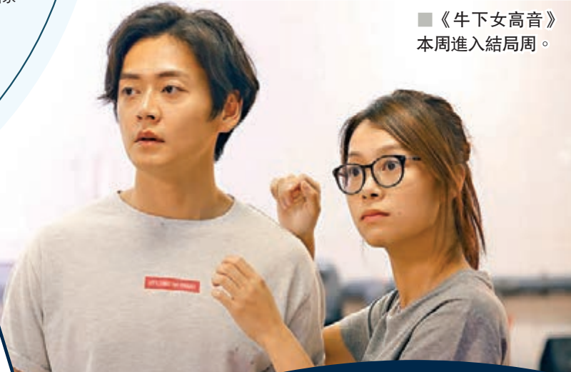
《牛下女高音》本周進入結局周。