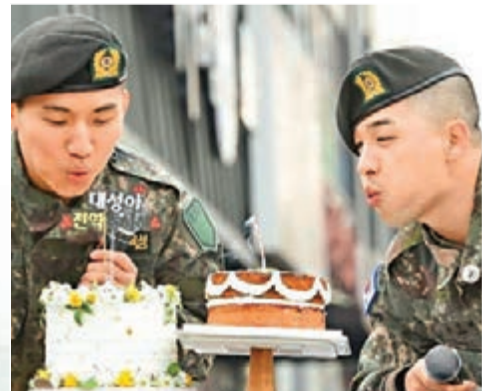
太陽和大聲獲粉絲們送上蛋糕祝賀。

他們退伍後,BIGBANG就已全員服役結束,團體動態備受矚目,談及未來團體的發展,會否合體等問題,太陽只表示:「之後需要從長計議,需要智慧努力討論,也要協調大家的意見,真的很想把好的一面展現給大家,總之我一定會更加認真的,並展現當