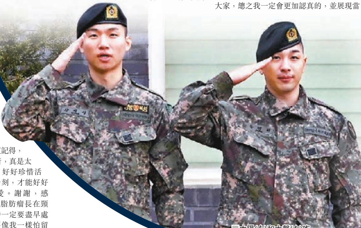
太陽(右)和大聲(左)昨日正式退伍。