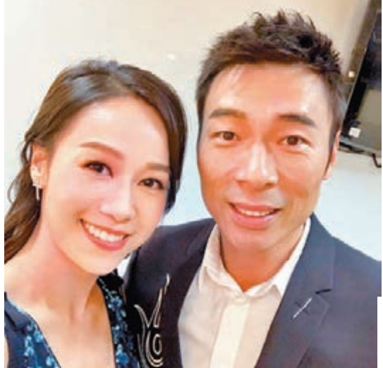
「安心事件」令兩位當事人事業煞停。資料圖片