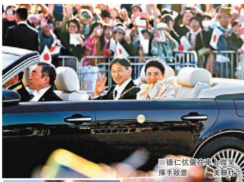
■ 德仁伉儷在車上微笑揮手致意。