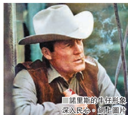
■ 諾里斯的牛仔形象深入人心。

曾擔任美國香煙品牌萬寶路代言人長達14年的諾里斯，昨日在科羅拉多州一間善終院舍逝世，享年90歲。諾里斯被視為第一代「萬寶路牛仔」，他在電視廣告中的牛仔形象深入人心，但他一生從不抽煙。