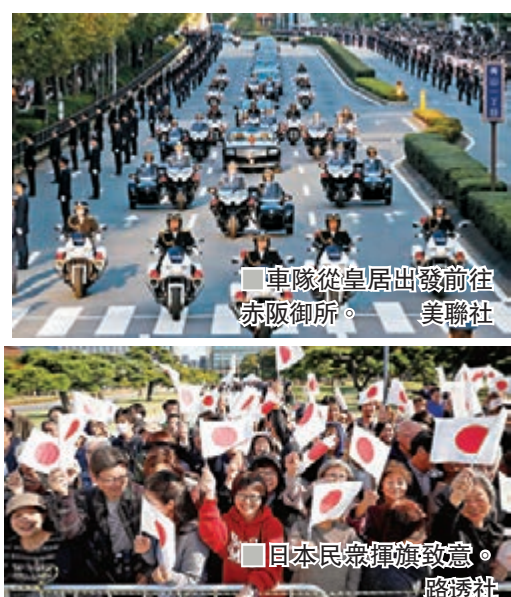
■ 車隊從皇居出發前往赤阪御所。