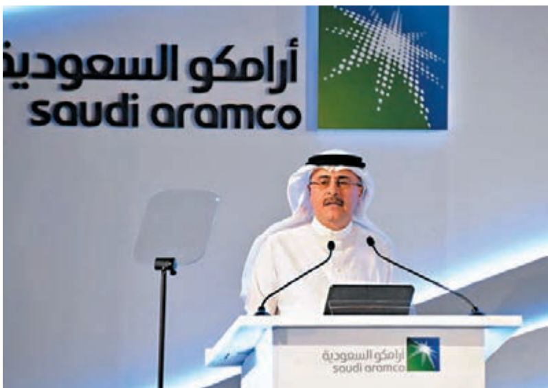
■ 沙特阿美宣佈於本月17日開始招股。

沙特阿美是全球最賺錢企業，去年盈利達1,110億美元(約8,687億港元)，較蘋果公司、鰹殼、埃克森美孚的總和更高，公司確認明年至少派息750億美元(約5,870億港元)，並考慮發放特別股息，但息率暫時未定，最終需取決於公司市值。消息人士透露，王儲穆罕默德最初希望公司估值達2萬億美元(約15.6萬億港元)，但隨着全球經濟放緩和沙特阿美石油設施受