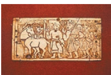
貝格拉姆出土,繪有佛教《本生經》故事的象牙雕刻。

是次展覽由康文署和阿富汗國家博物館主辦,展期至明年2月10日。有關展覽的詳情,可瀏覽hk.history.museum/zh_TW/web/mh/exhibition/current.html,或致電27249042查詢。