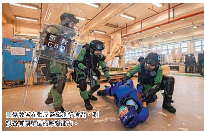
懲教署在壁屋監獄進行演習,測試各有關單位的應變能力。

一直以來,懲教署會不時按需要進行不同規模的演習,包括在懲教院所、各分區區域及部門層面,讓懲教人員熟悉處理不同事故的方法,目的是為在囚者提供一個安全和穩妥的羈管環境以便推行更生工作,使香港成為全球最安全的都會之一。