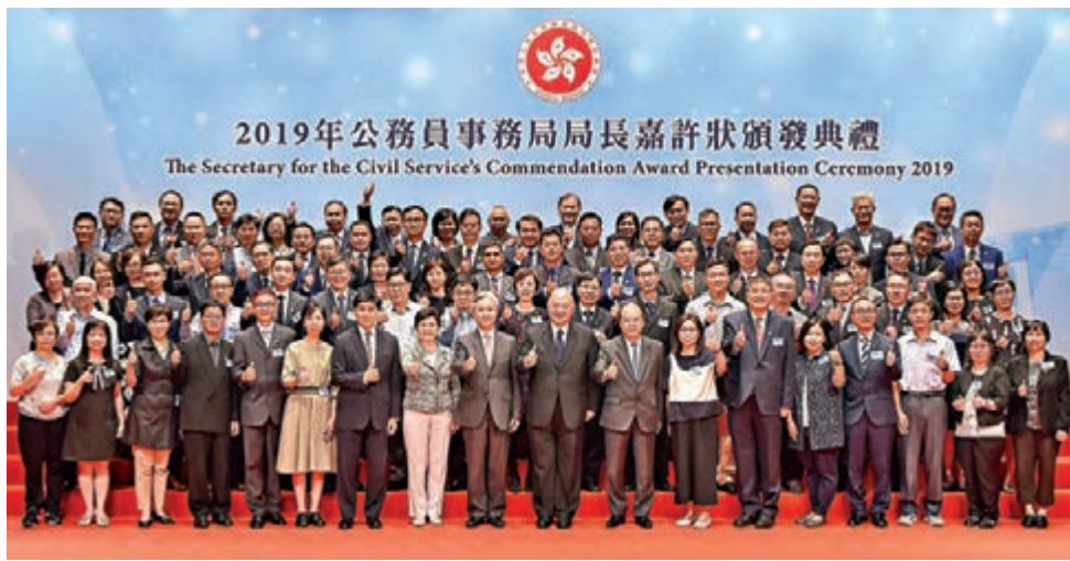
2019年公務員事務局局長嘉許狀頒獎典禮 The Secretary for the Civil Service's Commendation Award Presentation Ceremony 2019