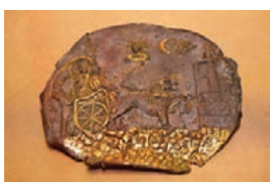
阿伊哈努姆神廟遺址出土的「西布莉圖案飾板」。