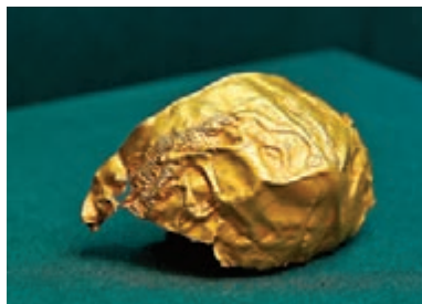
法羅爾丘地出土,黃金製的公牛紋金碗殘片。