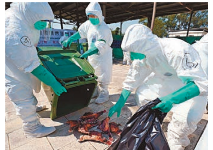
漁護署舉行演習,以檢視該署及其他部門應變禽流感的能力。

香港文匯報訊(記者 聶曉輝)漁護署日前舉行演習,以檢視一旦在香港發生高致病性禽流感需要銷毀家禽時,該署及其他部門的應變能力。