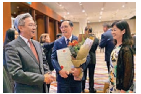
▲羅智光祝賀獲獎的公務員。