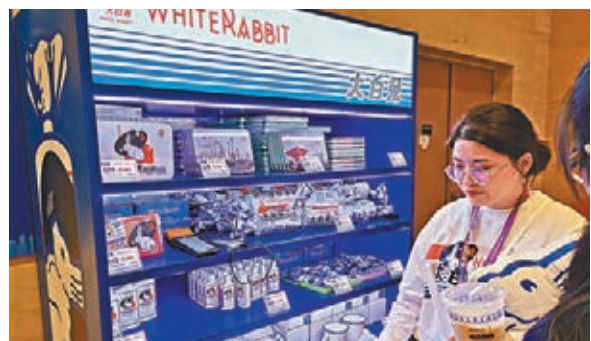
「大白兔」品牌在進博會新聞中心開設了展台，受到各國記者青睞。

600斤的藍鯨金槍魚、新西蘭羊肉、巴西牛肉、大白兔奶糖，這幾個看似完全沒有關聯的名詞在本屆進博會上，因為一家滬上老字號的國際化戰略被聯繫起來——上海的光明集團今年以參展商、採購商和服務商三重身份全面參與進博會。