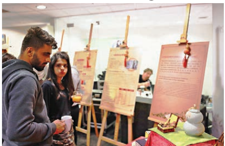
中國涼茶、中醫藥等文化越來越受到國際關注與接受。

數據顯示，中國涼茶越來越被國際消費者所接受，僅王老吉涼茶海外銷售網絡已覆蓋全球五大洲60個國家和地區。