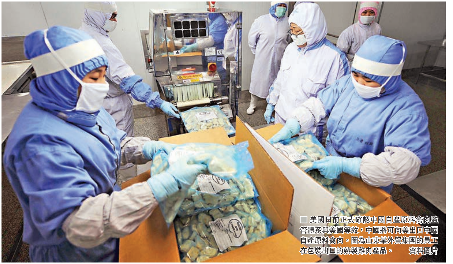
美國日前正式確認中國自產原料禽肉監管體系與美國等效，中國將可向美出口中國自產原料禽肉。圖為山東某外貿集團的員工在包裝出口的熟製雞肉產品。

美國是全球禽肉生產大國，擁有全球20%的產能，早前中國允許進口美國雞肉，2015年因美國爆發禽流感而實施禁令。而今中國豬肉等價格大幅上漲，市場供應不足，政府擴大進口來滿足國內需求，美國禽肉出口商此時獲得中國市場的「入場券」，正逢開拓中國市場的良機。