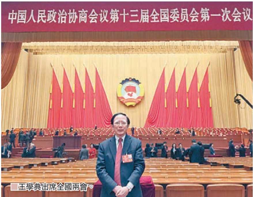
■王學典出席全國兩會。