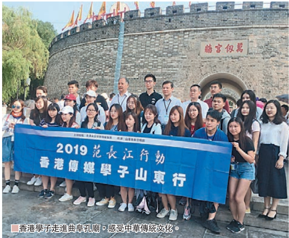
■香港學子走進曲阜孔廟，感受中華傳統文化。

這與他此前倡導的「政界儒學」一脈相承。儒家常言：「君子之德風，小人之德草，草上之風必偃。」社會的風尚很大程度上是由執政者的風尚、精英人物的風尚所引領。在其看來，儒學不僅要走進尋常百姓家，更應該首先進入政界和官場，培養執政者的君子人格。「各級官員若按儒家文化來自我約束，慎獨、克己、自律，足以消滅相當一部分人犯罪的可能。」