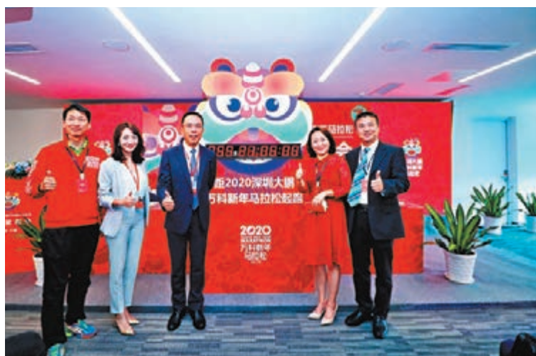
■「2020鵬馬」昨正式接受報名。

香港文匯報訊（記者 李望賢 深圳報道）一年一度的深圳大鵬半島國家地質公園為起點，沿途經過深圳東部特色山海景觀，終點設於大鵬廣場。本屆賽事首次聯合大亞灣核電站設立「核電賽段」，跑者可以一睹核電內部「神秘」景觀，並深度了解核電站的構成與原理，以及清潔能源的相關知識。 組委會表示，中國第一支以醫務工作者組成的醫師跑團將派出100名醫生為5000名跑者「保駕護航」。 香港文匯報訊（記者 李望賢 深圳報道）一年一度的深圳大鵬半島國家地質公園為起點，沿途經過深圳東部特色山海景觀，終點設於大鵬廣場。本屆賽事首次聯合大亞灣核電站設立「核電賽段」，跑者可以一睹核電內部「神秘」景觀，並深度了解核電站的構成與原理，以及清潔能源的相關知識。 其中，大眾報名開啟時間為2019年11月7日上午12時整。此外，精英跑者和超級粉絲的報名時間為11月6日12時至11月7日12時。據悉，精英跑者即在2014—2019年的任意一屆萬科新年馬拉松上，取得3個半小時以內完賽成績的男跑者和取得4小時以內完賽成績的女跑者；超級粉絲