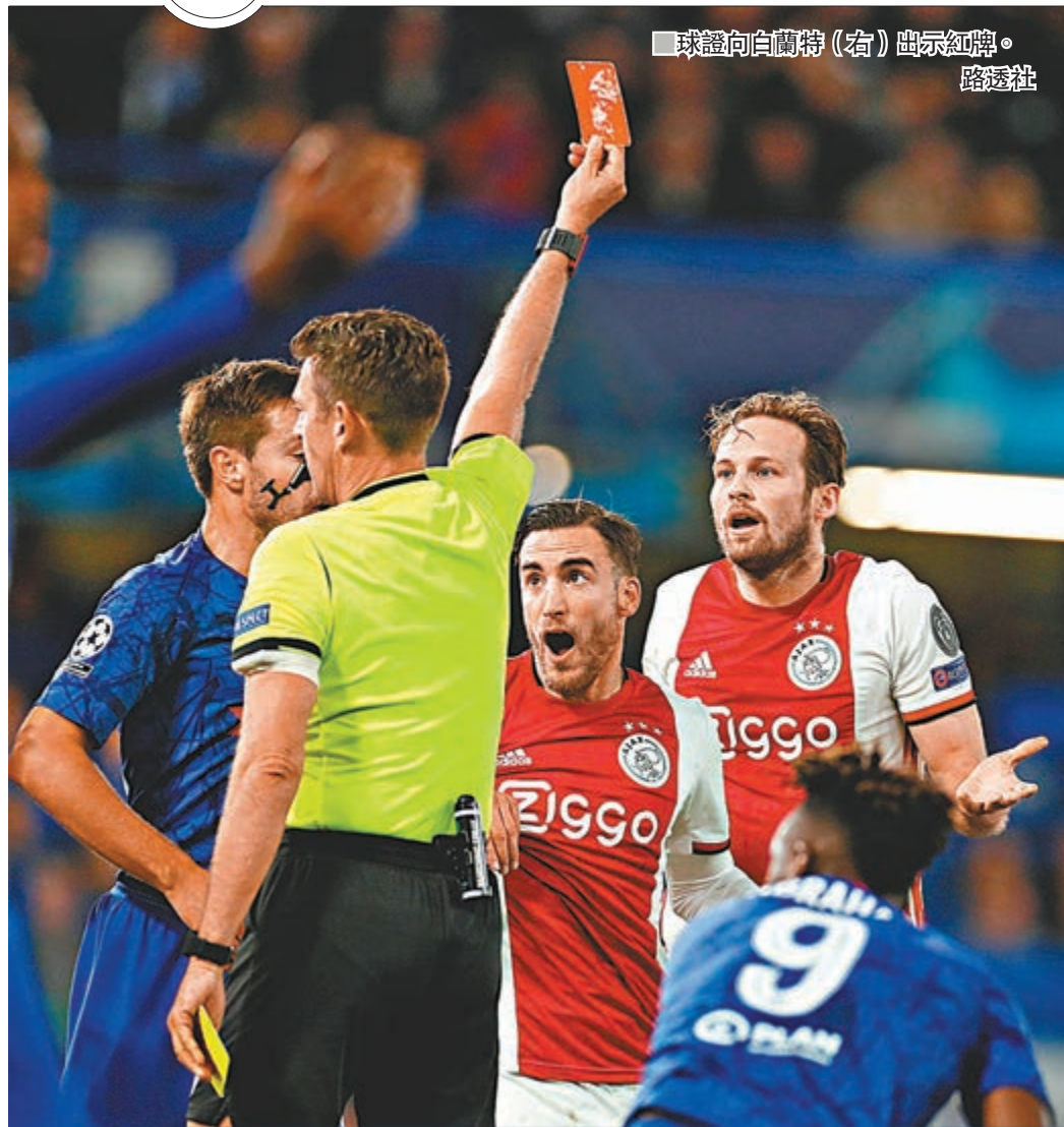
球證向白蘭特(右)出示紅牌。