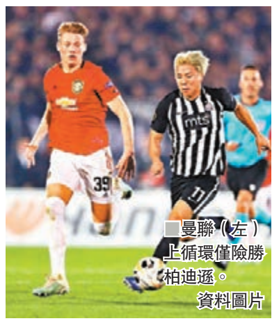
曼聯(左)上循環僅險勝柏迪遜。

曼聯在上循環對陣中,作客以1球淨勝柏迪遜,但如有看過那場比賽,相信均會同意柏迪遜表現根本比曼聯更優勝,若非欠點運氣早已扳平甚至反勝。今次來到奧脫福球場再戰,柏迪遜肯定會學習一眾英超中游球隊,以「泊大巴」全員防守方式應付曼聯,並希望尋找突擊機會爭勝。事實上,曼聯上場聯賽不敵般尼茅夫,已再次證明球隊無法於對手一心防守下取得入球,而後防亦會因欠集中而偶有失誤,再加上由於拉舒福特及丹尼爾古士等球員之前踢過太多比賽,今仗未必正選上陣,曼聯可能連於反擊上亦欠缺速度,未必可以如牌面般全取3分。