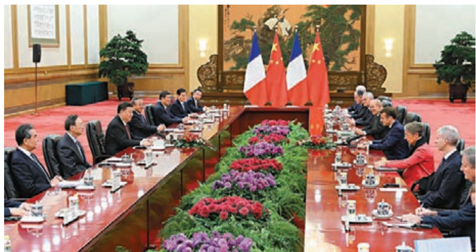
■昨日，習近平在北京人民大會堂同法國總統馬克龍會談。

香港文匯報訊 據新華社報道，國家主席習近平昨日在人民大會堂同法國總統馬克龍會談。會談後，兩國元首共同見證了多項合作文件的簽署，涉及航空航天、核能、應急管理、文化遺產、農業、工業、自然保護、金融、三方合作等領域。