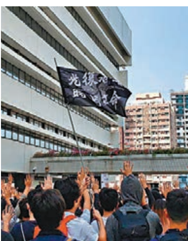
遊行期間有人高舉印有「獨」口號的旗幟。