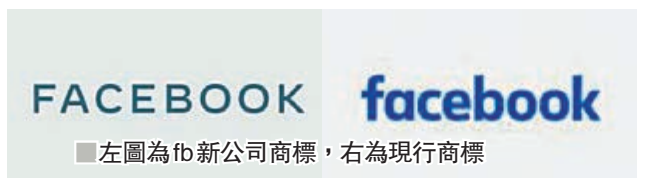
左圖為fb新公司商標，右為現行商標

屢爆醜聞的社交網站facebook母公司，前日公佈新的公司商標，被認為是希望藉此「洗底」，改變外界對公司的負面印象。新商標採用全大寫字樣FACEBOOK，並改用象徵公司旗下3大社交平台的字體顏色。新商標未來將以「from FACEBOOK」形式出現在