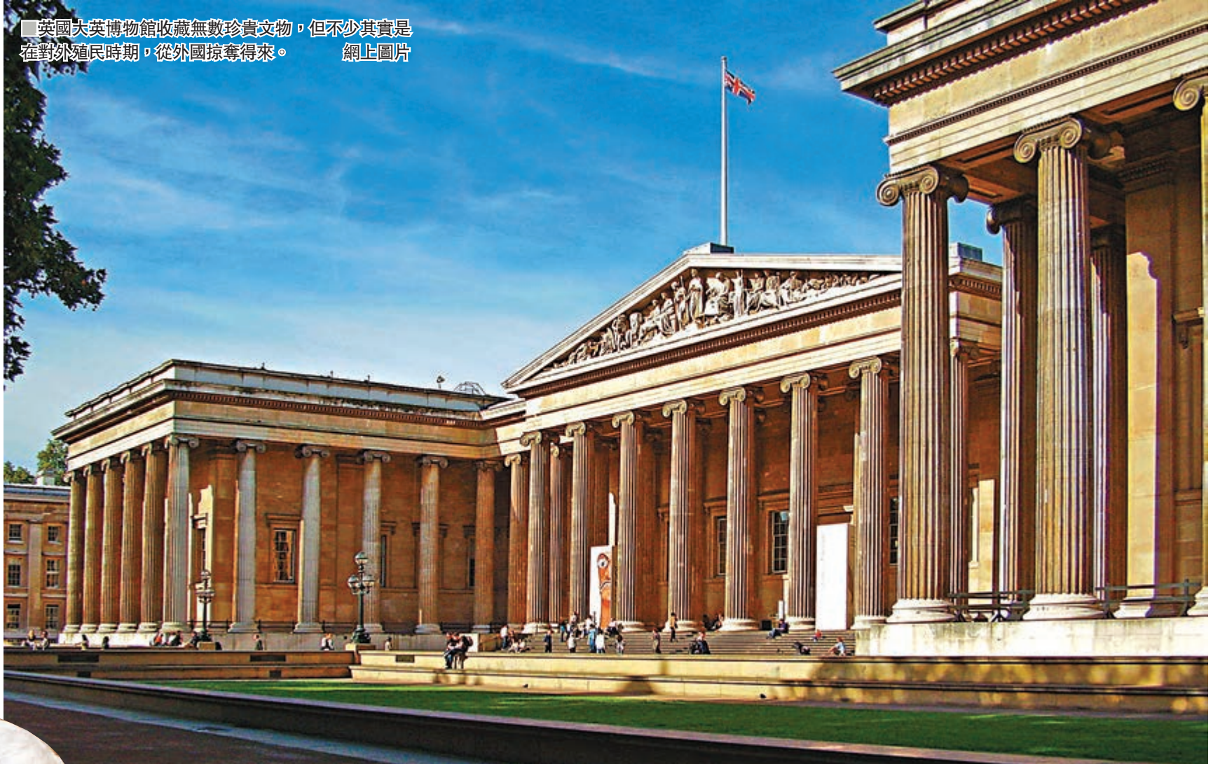
英國大英博物館收藏無數珍貴文物，但不少其實是在對外殖民時期，從外國掠奪得來。