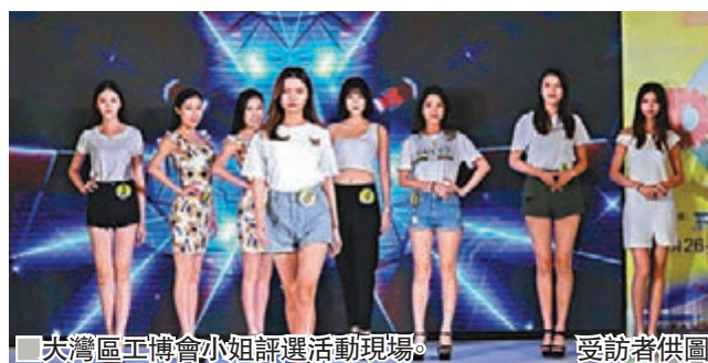
大灣區工博會小姐評選活動現場。受訪者供圖

此外，香港創新科技及製造業聯合總會主席李遠發也在當天的活動上指出，訊通與FITMI有着非常相近的理念，雙方透過多年來所經歷的緊密合作，一起推動香港業界的創新科技發展。DMP工博會在大灣區打造了一個更大的專業平台，匯聚了來自不同地區的參展商，不但展示出所有參展商的創新科技成果，更加促進了彼此之間的緊密交流。FITMI將會安排在今次的展覽會中，投放更大的資源，去設置一條工業4.0試點示範生產線，向業界展示和推廣工業4.0的實際操作及應用成效。