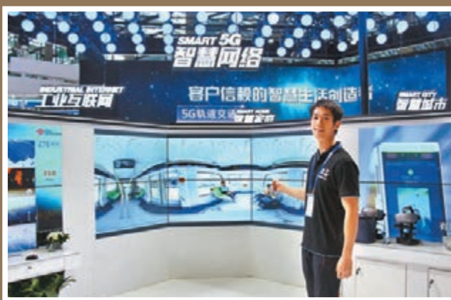
深圳明年全市率先建成5G智慧城市。

在重大創新載體方面，建國家實驗室、國家產業創新中心、國家製造業創新中心、國家工程研究中心、產業技術功能型平台；在新興產業集群方面，建新型顯示器件產業集群、人工智能產業集群、智能製造裝備產業集群、生物醫藥產業集群；在產業鏈重點領域關鍵環節，主要關注集成電路、射頻器件、微機電系統、核心工業軟件、醫療影像設備等領域的設計、研發、製造、中試環節。