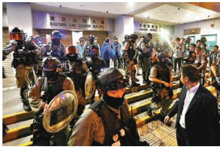
■防暴警在東區法院大樓外戒備。

暫毋須答辯，其中兩名男女因留醫而缺席聆訊，其餘三人出庭受審，但辯方發現檢控同意書及英文控罪書上被告的姓名及控罪內容有誤，並非有效文件，無理據繼續檢控程序，應即時釋放所有被告。控方解釋為手民之誤，主任裁判官