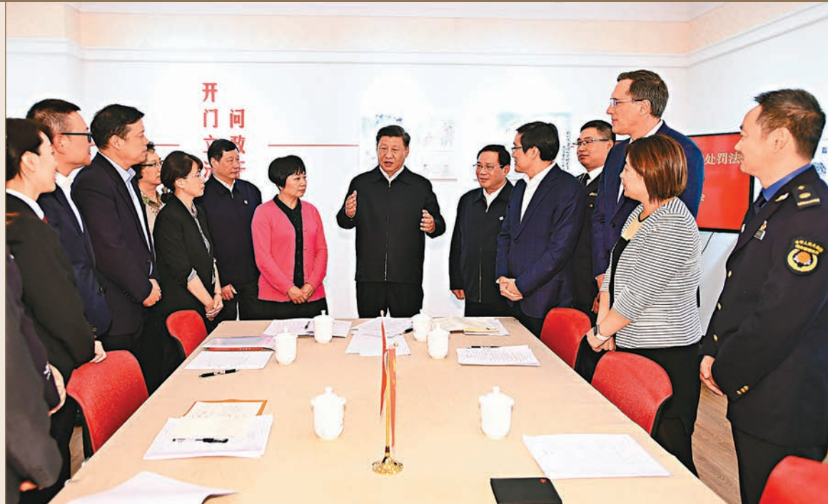
習近平總書記昨日在上海市考察調研。當天下午，他來到楊浦區濱江公共空間楊樹浦水廠濱江段、長寧區虹橋街道古北市民中心實地考察，了解城市公共空間規劃建設和社區治理與服務情況，並同當地居民親切交談。 文：新華視點