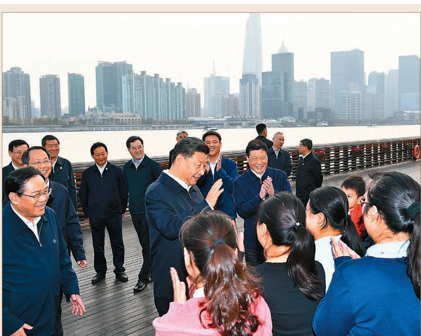
習近平在上海考察調研