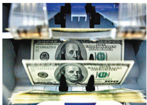
美匯近日走弱。 資料圖片

另外周四公佈的資料顯示，中國10月份製造業採購經理人指數大幅下滑，代表第三季度末投資和工業企穩的局面將會難以維持非製造業PMI降幅更大，幾乎下降接近一個點，觸及2016年初以來的最低水平。這代表經濟轉差情況在開始體現在服務業。