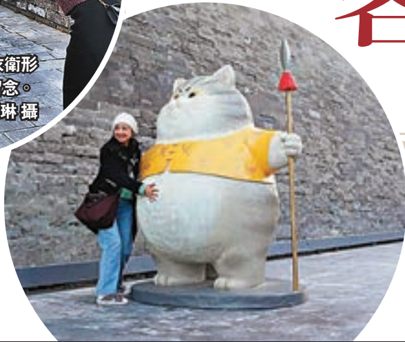
遊客與清代御前侍衛形象「御貓」合影時，手忍不住摸了摸它的肚子。