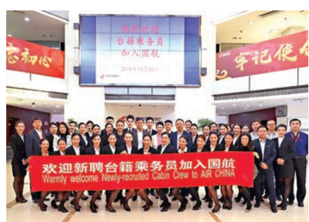
來自台灣地區的32名青年人已完成入職手續，正式加入國航空中服務隊伍，成為國航歷史上首批台籍乘務人員。

《聯合報》分析文章則認為，所謂「中共代理人修法」觸動廣大台商敏感神經。機關算盡的民進黨恐怕尚未傷人七分，先損己三分。