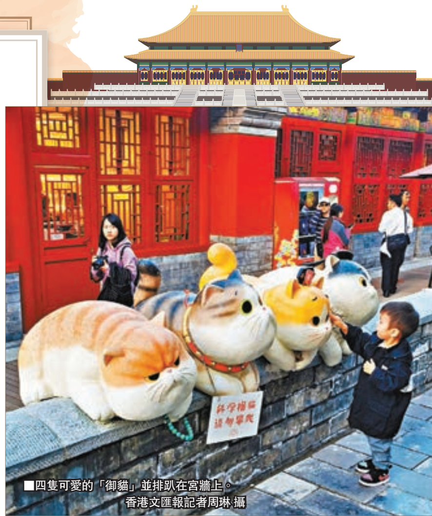
四隻可愛的「御貓」並排臥在宮牆上。