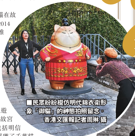
民眾紛紛模仿明代錦衣衛形象「御貓」的神態拍照留念。

故宮相關負責人表示，御貓雕塑是結合年輕人喜歡的故宮貓元素進行製作的，也做了一些萌化處理。預計後期會根據遊客反映和設計安排，推出更多御貓雕塑。