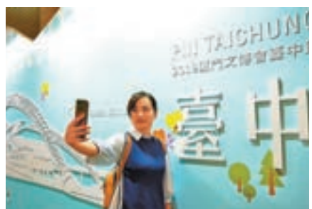
參展民眾在台中館自拍。

香港文匯報訊（記者 蔣煌基 廈門報道）第十二屆海峽兩岸（廈門）文化產業博覽交易會（簡稱「海峽兩岸文博會」或「廈門文博會」）昨日在福建廈