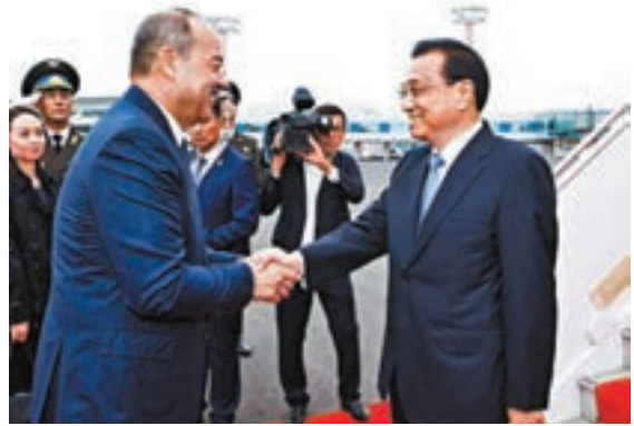
當地時間11月1日，李克強抵達塔什干出席上海合作組織成員國政府首腦理事會第十八次會議並對烏茲別克斯坦進行正式訪問。

香港文匯報訊 據新華社報道，當地時間11月1日下午，應烏茲別克斯坦共和國總理阿里波夫邀請，國務院總理李克強乘專機抵達塔什干機場，將出席上海合作組織成員國政府首腦（總理）理事會第十八次會議並對烏茲別克斯坦進行正式訪問。李克強在與阿里波夫的會晤中強調，中烏要抓住機遇，擴大雙向開放，打造務實合作新格局。