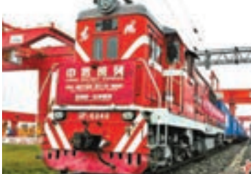
中歐班列長安號昨日開行，首次使用全程統一運單。

香港文匯報訊 據新華社報道，中歐班列長安號「統一運單」首列1日開行。此次中歐班列長安號首次使用全程統一運單，班列在各國邊境站不需要重新辦理運輸單據，真正實現「一單到底」。這標誌着中歐班列長安號進一步優化組織模式，提高了運輸實效，降低了物流成本。