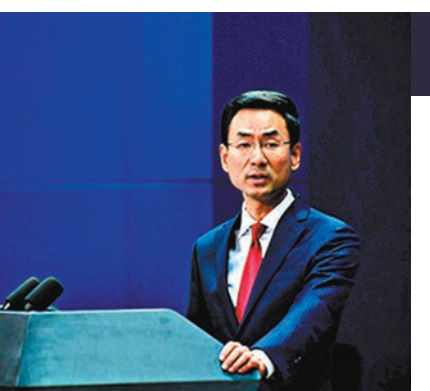
中國外交部發言人耿爽昨日主持例行記者會。

耿爽表示，目前報名參展的美國企業數量達到了192家，比去年增長18%，美方參展面積達到4.75萬平方米，居各參展國首位。這再次說明，美國企業看好中國的經濟前景，看好中國的市場潛力，願意繼續投資中國，願意繼續深化與中方的務實合作。畢竟跟中