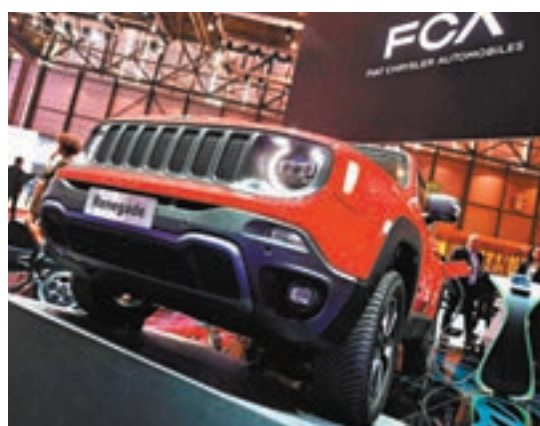
快意佳士拿與法國標緻雪鐵龍合併後，將成為全球第4大車廠。

兩間車廠的董事會發表聯合聲明，公佈雙方同意以各佔50%股權形式合併，預期日後每年總銷售額達1,700億歐元(約1.5萬億港元)，盈利達110億歐元(約959億港元)，在目前市場需求放緩下，合併有助公司建立因應市場的規模。此外，兩間車廠均正研發電動車，合併後可節省大量成本，在協同效應下，無需關閉任何廠房，也可節省37億歐元(約320億港元)成本。