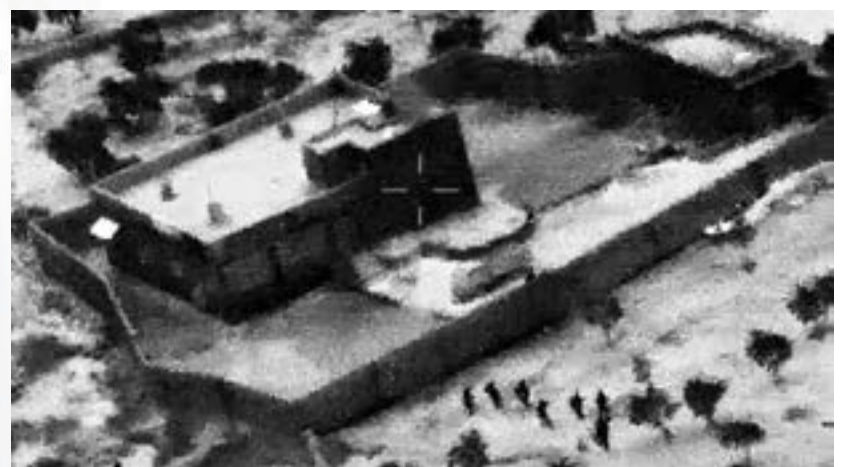
片段顯示美軍士兵接近巴格達迪藏身的建築物。