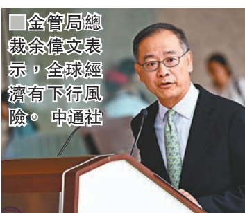
金管局總裁余偉文表示,全球經濟有下行風險。

香港文匯報訊(記者 岑健樂)本港暴力示威不斷,8月香港銀行的港元存款曾按月大減1,110.8億元,跌幅1.6%,引起外界憂慮香港會否出現「走資」潮。金管局數字顯示,9月份港元存款升0.6%(約410億元),金管局總裁余偉文指,相信與新股市場較為活躍有關,而年初至今港元存款亦有所上升。