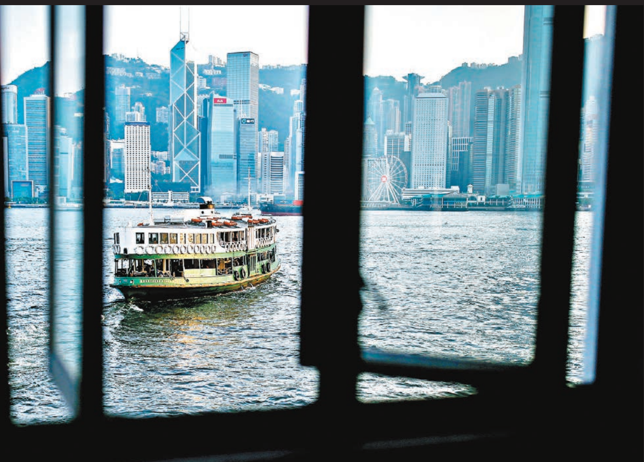
政府預料,本港全年經濟很可能會負增長。

政府統計處昨公佈第三季經濟生產總值預估數字,第三季經濟增長按年下跌2.9%,為自2009年第三季「環球經濟大衰退」以來首次錄得季度按年下跌,較市場預期的下跌0.5%為差,大遜首季0.6%和次季0.4%的輕微增長,主要由於內部及對外需求均表現疲弱所致。經季節性調整後按季比較,實質本地生產總值繼第二季下跌0.5%後,第三季跌幅擴大至3.2%,顯示香港經濟已步入技術性衰退。首三季合計,香港經濟按年收縮0.7%。